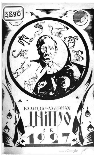
Титульна сторінка календаря-альманаса «Дніпро», 1927 р.

На момент написання драми Юрій Липа вів активне громадське і творче життя, систематично публікував свої твори у періодичних виданнях. Зокрема, згаданий твір був опублікований за життя автора у календарі-альманасі «Дніпро» (м. Львів) у 1925 та 1927 роках. Видання 1927 р. зберігається у бібліотеці Індіанського університету (США). У 1998 р. твір був повторно опублікований у першому номері науко-