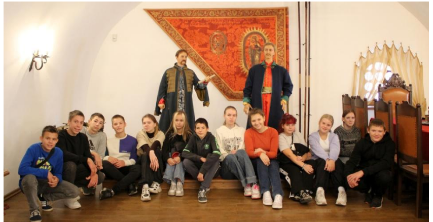
Екскурсанти на виставці «Ясновельможні гетьмани. Життя для України». Фото 2024 р.

Підсумовуючи, можна впевнено сказати, що наш заповідник залишається активним осередком історії та культури. Ми продовжуємо працювати над новими виставковими проектами та розширенням інклюзивного простору, покращуємо організацію обслуговування відвідувачів та розвиваємо міжнародну співпрацю, плануємо та діємо з вірою у Збройні сили України та Перемогу!