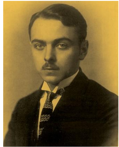
Юрій Липа (1900-1944)

Найбільші душевні пристрасті розгортаються у творі в сцені візиту закоханої Кочубеївни і подальшої розмови між нею і Гетьманом. Тут автор демонструє свою обізнаність із відомими листами, цитуючи їх устами Мазепа: «...у