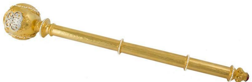
Реконструкція булави гетьмана Кирила Розумовського. Зібрання Національного заповідника «Гетьманська столиця»

Упродовж 14 років гетьманування Кирилу Розумовському вдалося здійснити реформування в системі судочинства, військової справи, освітньої галузі та медицини. Своїми політичними поглядами і діями гетьман доводив, що Гетьманщина має відбутися як самостійна незалежна держава. Його постать безперечно заслуговує на повагу та гідне місце в нашій історії.