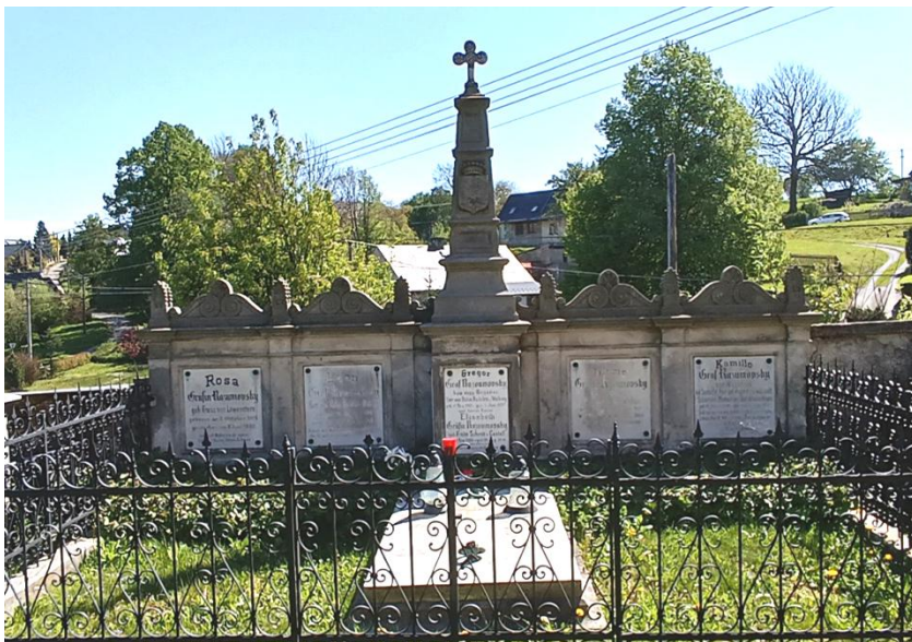
Родинна усипальниця Розумовських у Радкові. Фото 2024 р.

На надгробках містяться написи, які включають ім'я з прізвищем померлого, роки життя, посаду або становище у суспільстві та епітафію. Епітафія, присвячена правнуку гетьмана України влучно відзначає чесноти Каміла Розумовського та висловлює вдячність покійному: «Забути себе і зробити щасливими інших було метою його життя, творити добро було його метою. Нехай він завжди буде прикладом для своїх дітей та онуків».