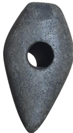
Кам'яний молоток VII – III тис. до н.е. Зібрання Національного заповідника «Гетьманська столиця»

стиль роботи майстра, організацію виробничого процесу, залучення до нього інших осіб, розподіл праці між ними та ін. Аналіз полив'яного зображення дозволяє прослідкувати не лише панування певної мистецької традиції у виготовленні кахлі, а й естетичні смаки замовника. Хімічні та механічні аналізи виробів, порівняння їх з іншими зразками з більш точно визначеними умовами виявлення, можуть поглиблювати наші знання про походження виробів, особливості організації гончарного ремесла та технологічних процесів тієї епохи, писемні свідчення про які не збереглися або збереглися у обмеженому обсязі.