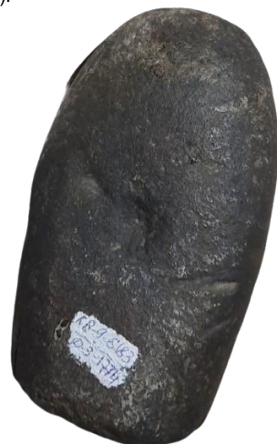
Кам'яна сокира VII – III тис. до н.е. Зібрання Національного заповідника «Гетьманська столиця»

Місця виявлення знахідок мають інформативний потенціал. Кахлі часів К. Розумовського визначають межі забудови міста, знахідки кам'яних сокир, відповідно, вказують на місця можливого розташування поселень епохи бронзи (друге тисячоліття до нашої ери).