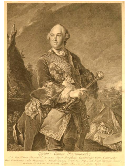
Гетьман Кирило Розумовський, 1758 р. Мідьорит Георга-Фридриха Шмідта.

Урочистості 22 лютого 1750 р. почали початок державної діяльності ге-