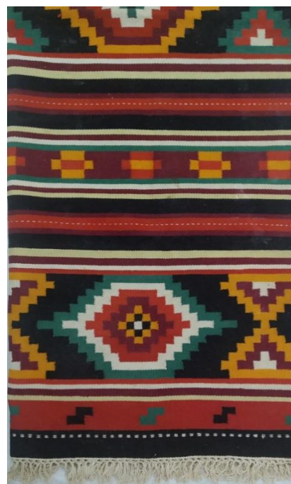
Малюнок килима «Тепло і добро». Сергій Нечипоренко, 1986 р.

Килими Сергія Нечипоренка з фондової колекції заповідника є прикладом майстерності та креативності автора. Вони відзначаються технічною досконалістю та гармонійно підібраною кольоровою гамою, захоплюють своєю художньою цінністю та відображають багату культурну спадщину України.