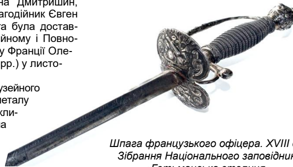
Шпага французького офіцера. XVIII ст. Зібрання Національного заповідника «Гетьманська столиця».

Ця шпага має особливу історико-культурну цінність як видатний витвір європейського зброярського мистецтва XVIII ст. Впродовж 2019-2022 рр. шпага французького офіцера була одним з центральних експонатів виставки «Григорій Орлик: видатний син видатного батька України. Повернення на Батьківщину» та незмінно привертала увагу екскурсантів.