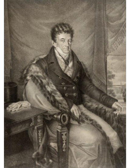
Андрій Розумовський. Літографія. Автор Джозеф Ланцеделлі Старший. Перша чверть XIX ст. Австрійська національна бібліотека

Загалом, усі вулиці, присвячені гетьману Розумовському, виникли згідно з чинним законодавством України та внаслідок ініціативи громадян і органів