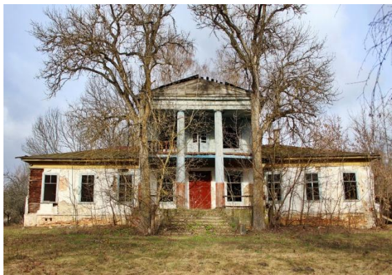
Палац Долинських у селі Пекарів на Чернігівщині. Фото 2020 р.

До двору Г. Долинського належали: пустий плець (земля під будинком та городом, призначена для забудови), придбаний власником в 1759 р. у батуринського козака Григорія Бандеровського за 25 рублів; п'ять сінокосів загальною площею 2 188 квадратних сажнів (4669 м 2 ); ліси, здебільшого придатні для дров, загальною площею 1859 кв. сажнів (3967 м 2 ) та гайові зруби загальною площею 1620 кв. сажнів (3457 м 2 ).