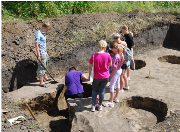
Археологічні дослідження на поселенні «Батурина», 2024 р.

Пізніше на цій території мешкали їхні нащадки – носії сосницької культури. Вони також жили осіло, розводили велику і дрібну рогату худобу, коней та свиней. Допоміжна роль відводилася полюванню, рибальству і збиральництву. Глиняний посуд вони орнаментували відбитками шнура, штампа, прокресленими лініями, дрібними насічками. Часто на ньому зустрічаються й горизонтальні мотиви та трикутники.