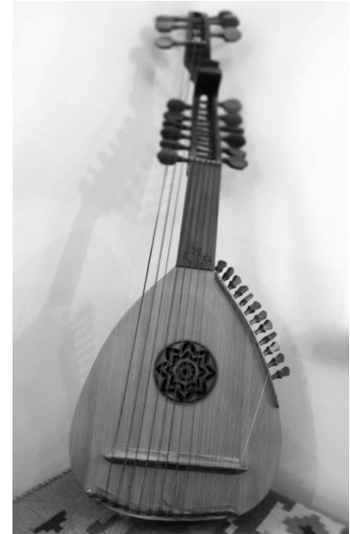
Торбан XVII ст. Копія. Зібрання Національного заповідника «Гетьманська столиця»

Військові музиканти та оркестри відігравали важливу роль у церемоніалах прийому іноземних гостей при дворі Івана Мазепи. Наприклад, під час прийому російського посольства у Батурині в 1688 р. гетьман зустрівся по-справді разом з генеральною старшиною та військовим оркестром. Окрім цього, військові музиканти та оркестри супроводжували гетьманський уряд під час слу-