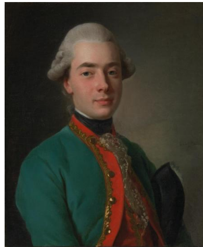
Портрет Андрія Розумовського. Художник О. Рослін. 1776 р.

Майже кожен лист від гетьмана сповнений нарікань на стан його здоров'я, адже більшість листів припадають на ті роки, коли гетьман був на схилі літ: «з настанням зими стан мого здоров'я, здається, покращився...бо восени від сирого повітря я страждав». Наголошує гетьман і на важливості гарного лікаря: «хочу я мати практика гарного. Якби такий зустрівся, тобі то я був би дуже радий мати такого». Наприкінці практично кожного листа Розумовський додає коротку інформацію про погоду. Наприклад, у листах з Батурина читаємо: «у нас стає схоже на весну, але ще скрізь лежить сніг (березень)», «зима у нас, здається, така ж сувора та студена, як літо було, жарке та сухе. І те і те мені не до вподоби (грудень)».