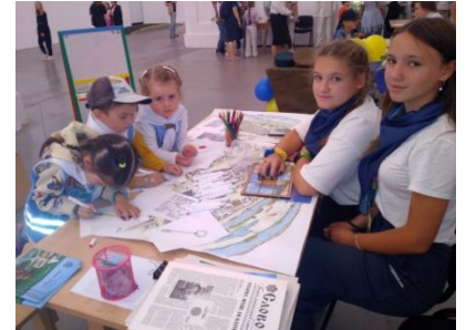
Гуртківці-учасники фестивалю «NEOСвітній Арсенал», 5 вересня 2023 р.

ри, складали пазли, проявляли власну фантазію розмальовуючи малюнки – музеї та пам'ятки Батурина.