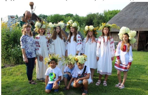
Гуртківці в традиційному народному українському вбранні, червень 2023 р.

Велику цікавість у гуртківців викликала низка інтерактивних занять, яка була присвячена традиційному народному жіночому вбранню Чернігівщини XIX ст. Адже споконвіків народний стрій виконував не тільки практичну функцію, а й ніс у собі певний інформаційний код, був засобом соціальної, сімейної та вкової ідентифікації. Для того, щоб краще це уявити, серед дітей-гуртківців обираються дві дівчинки, яким керівник гуртка пропонує на деякий час перетворитися на справжній україночок. Для такого перевтілення були підібрані демонстраційні комплекти жіночого/дівочого одягу і головних уборів поч. XX рр. Всі