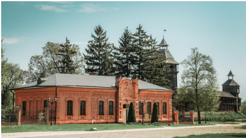
Музей археології Батурина. Фото Марії Петренко, 2021 р.

У лютому 2022 р., з початком повномасштабного збройного вторгнення російської федерації на територію України, музей призупинив свою діяльність. Сьогодні колектив заповідника працює над тим, щоб невдовзі він знову відкрив свої двері для відвідувачів Національного заповідника «Гетьманська столиця».