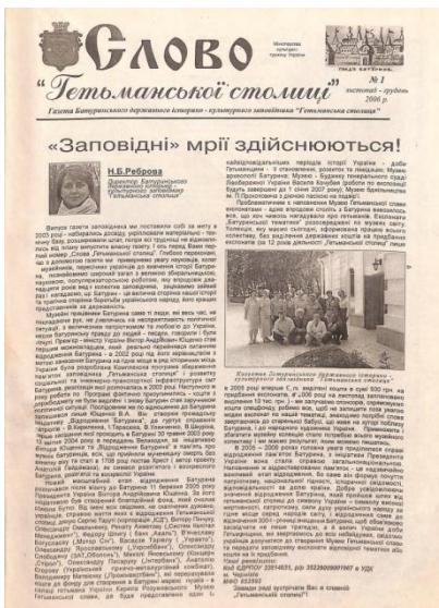
Перший випуск газети «Слово Гетьманської столиці», 2006 р.

Вітаємо всіх дотичних до створення цієї газети, які послідовно і системно працюють над кожним випуском!