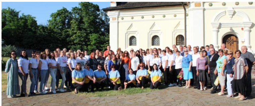
Колектив Національного заповідника «Гетьманська столиця», 2023 р.

Безмежно вдячні, що протягом року заповідник не залишався наодинці з викликами війни, а отримував дружню допомогу від меценатів. А саме завдяки нашим відвідувачам ми відчували, наша праця не даремна – дякуємо, що були з нами в цей непростий рік!