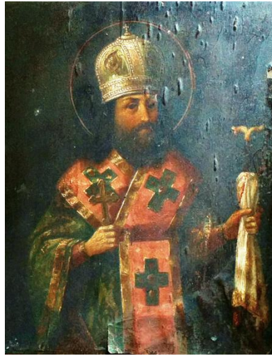
Ікона «Святитель Феодосій, архієпископ Чернігівський», кінець XIX – початок XX ст. Із зібрання НІКЗ «Гетьманська столиця».

Клопотався гетьман і про те, щоб саме Феодосій управляв Чернігівською єпархією по смерті Лазаря Барановича. Ставши архієпископом, за підтримки гетьмана, він належним чином дбав за ввірену йому єпархію, опікувався розбудовою храмів, приділяв значну увагу розвитку книгодрукування. Земне життя Феодосія закінчилося у 1696 р. За двісті років по смерті архієпископа, його мощі виявилися нетлінними. Цей факт та ряд чудесних зіплень, які часто траплялися біля його поховання, не залишилися без уваги і у 1896 р. святителя