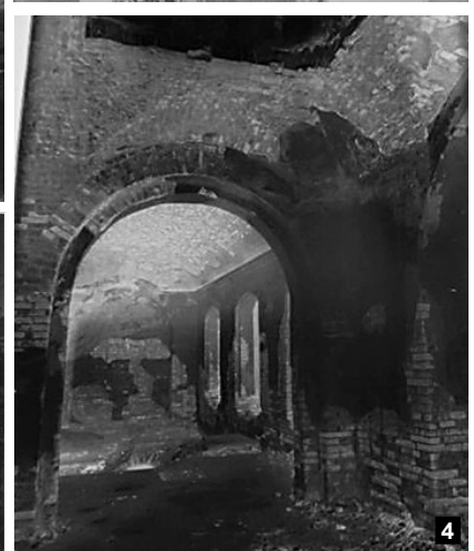
Фото М. Ушакова палацу Кирила Розумовського в Батурині (1908 р.): вгорі – північно-східний фасад; унизу – 1) фрагмент карнизу, 2) фрагмент оздоблення однієї із зал, 3) склепіння напівпідвалу, 4) прохідна кімната з видом на залу.