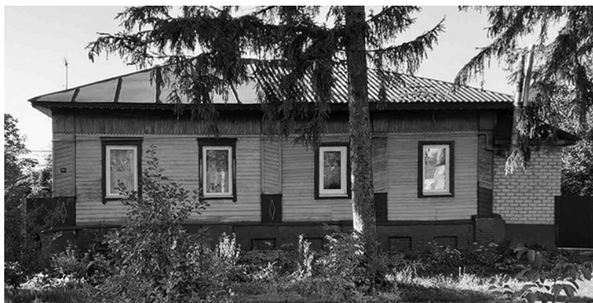
Будинок 1889 року. Батурин, вул. ім. В. Ющенка, 42.

До сьогодні стоять на вулицях Батурина старі будинки – німі свідки минулого, а ми перегорнули ще одну сторінку історії нашого містечка.