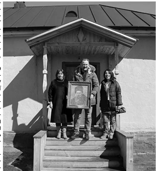
Родина Мартинюків із подарунком для музею «Козацький двір».

Приємно вразили живий інтерес та небайдужість до цієї теми з боку поці-