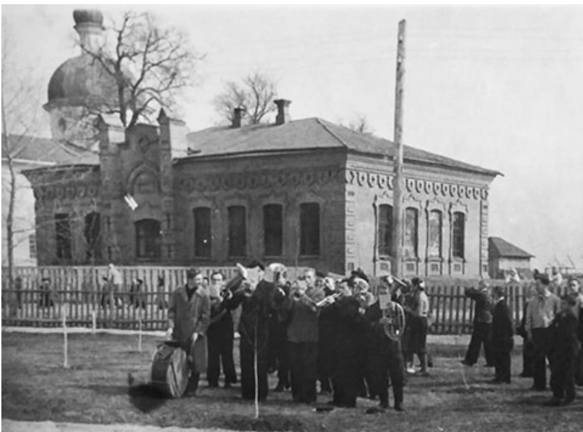
Парафіяльна школа Воскресенської церкви (1904 р.), середина XX ст.

Церковнопарафіяльні школи відіграли значну роль у розвитку початкової освіти у кінці XIX – на початку XX століття, виступаючи основним джерелом знань, навчаючи дітей грамотності, зміцнюючи християнську мораль. Парафіяльні школи були єдиним способом здобути грамоту сільськими дітьми.