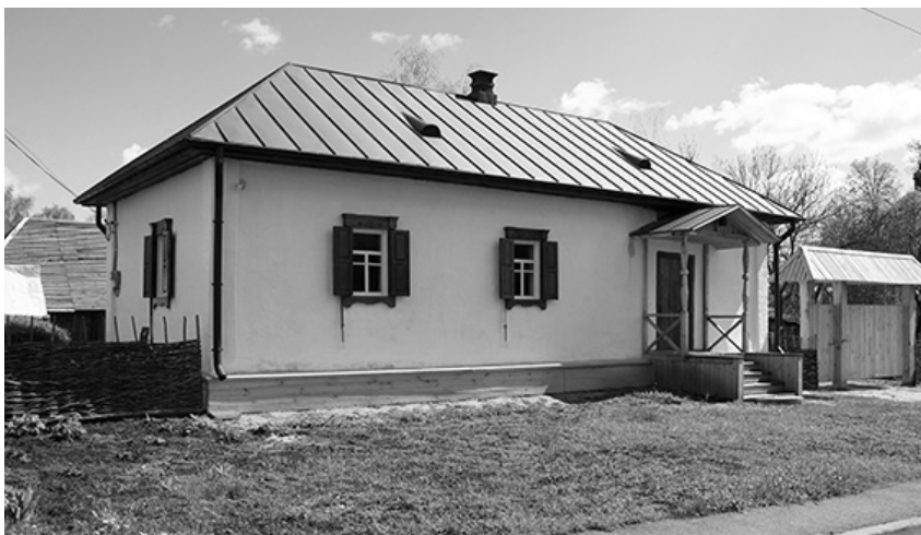
Хата музейного комплексу «Козацький двір», 10 травня 2021 р.

Ми безпечні, ми пізнавальні, ми інтерактивні!