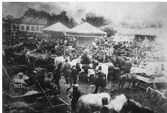
Ярмарок на Воскресенській площі Батурина. 1907 р.

міщення Батуринської волості (сучасне перехрестя вулиць Гетьманської, ім. В. Ющенко та провулку Гетьманського). Після ярмарку територія вигону та ставок Балка, який знаходився поруч, були засмічені. Місцеві жителі на сході вирішили звернутися до Чернігівського губернатора з проханням і надалі проводити ярмарки на Воскресенській площі. Тому Дмитрівський ярмарок став єдиним, який пройшов біля будинку волосного правління. У 30-х рр. XX ст.