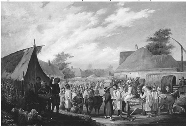
Ярмарок у містечку Ічня. Художник В. Штернберг (перша половина XIX ст.).

на українському ярмарку влаштували каруселі. Наприклад, на Покровському ярмарку в місті Лубни, за описом Я. Забело, для ярмаркової публіки пропонували різні атракції, зокрема карусель. Її господар, словак за національністю, розіжджав по багатьох містах і ярмарках. За катання він брав плату – по 3–5 коп. з особи. Судячи з прибутку, який він отримував, народ велими любляв такий вид розваг. У Ромнах він заробив 300 руб., а от у Лохвиці – 6 руб. Батуринські ярмарки були не виключенням. На чорно-білій світліні 1907 року, яка зберігається у фондовій колекції Національного заповідника «Гетьманська столиця», зображено ярмарок на Воскресеньській площі Батурина. По центру бачимо дві каруселі з конусоподібними дахами, праворуч від них – підвищення з накриттям, напевно, сцену. Фото демонструє, що батуринські ярмарки супроводжувалися веселими розвагами та виступами акторів і музик.