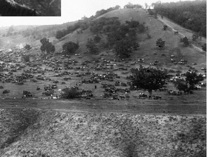
Ярмарок у Чернігові (початок XX ст.).

У 1901 р. на сході жителів «батуринський лесничий г. Ш. посоветовал крестьянам ходатайствовать перед Министерством Земледелия об уступке под школьную усадьбу здешней ярмарочной площади в обмен на такое же количество общественной земли при выезде на Конотоп-