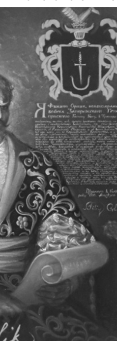
Гетьман Пилип Орлик. Худ. А. Івахненко, 2002 р. НІКЗ «Гетьманська столиця».

Він, як і вся генеральна старшина, підтримав рішення гетьмана Мазепи про альянс зі шведським королем Карлом XII. Пилип Орлик був серед тих, хто після Полтавської битви емігрував з гетьманом на територію Османської імперії і був разом з Мазепою до останнього подиху життя Гетьмана.