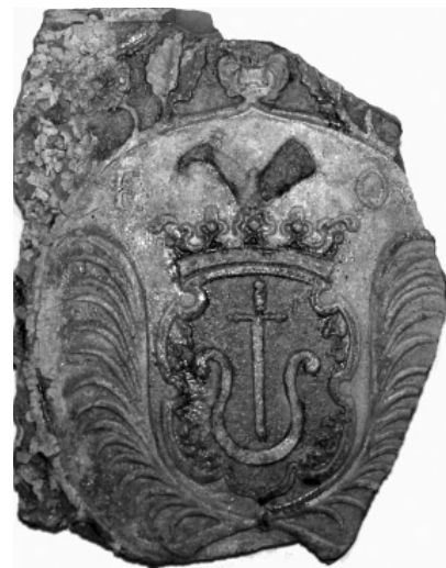
Фрагмент кахлі з будинку Пилипа Орлика в Батурині. XVIII ст.

За давньоруської доби Чернігів, на рівні з Києвом, був колискою української державності. У часи Гетьманщини цю традицію Чернігівщина втримала і поглибила – саме тут, в Батурині, 53 роки знаходилася резиденція українських гетьманів – політична столиця Війська Запорозького. Світогляд гетьмана Івана Мазепи, Пилипа Орлика та кращих представників козацької старшини, згуртованих на його теренах, ліг в основу цього документа. Тому саме Батурин є одним із тих місць, які безпосередньо пов'язані зі змістом «Договорів і постанов прав і свобод Війська Запорозького».