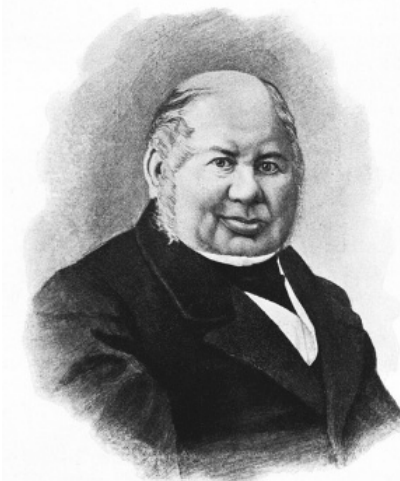
Олександр Васильович Кочубей (1788–1866 рр.). Фото середини XIX ст.

дав всі свої маєтності Селянському поземельному банку і виїхав за кордон. Так завершилася епоха існування панських маєтків, а Михайлівську церкву в Кинашівці зруйнували за радянських часів. Так загинула ще одна з перлин культового українського зодчества. Зараз на місці, де був храм, знаходиться дитячий садок.