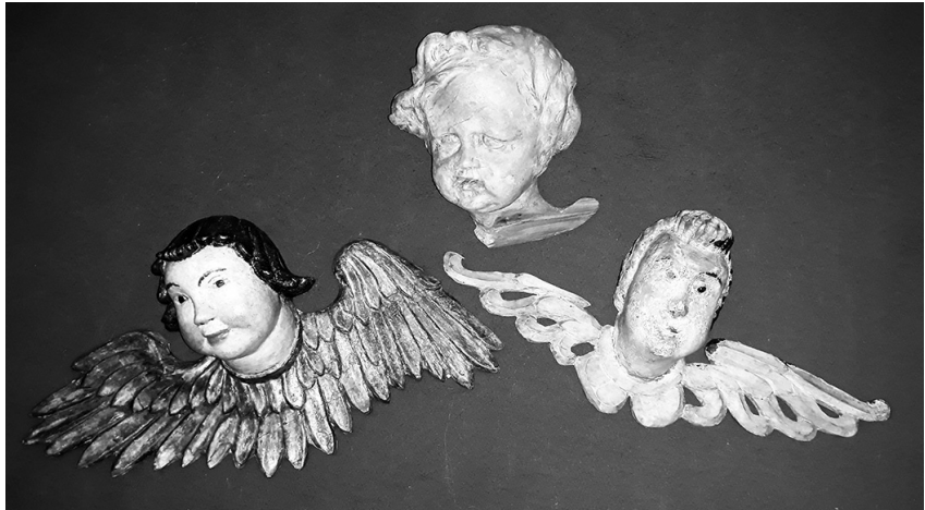
Дерев'яні скульптури XVIII–XX ст. з експозиції палацу гетьмана Кирила Розумовського.

коротке. Пишність форм підкреслюється подвійним підборіддям та пухкими щоками. Яскраво передані емоції, втілені за допомогою дерев'яної пластики та динаміки у виразі обличчя, дають змогу вважати, що майстер, який працював над фігурою, володів майстерністю досконало переда-