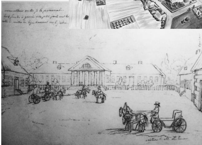
Гетьманський палац К. Розумовського. Малюнок М.І. Тюргейм. 1819.

отримав 116 руб., за липень-листопад – 400 руб., в 1764 р. отримав 800 руб.