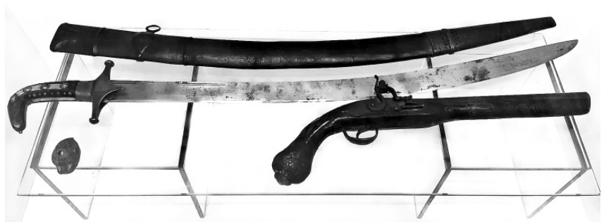
Шабля з піхвами та пістоль XVIII ст. з експозиції Музею археології Батурина.

Торкаючись питання професійної приналежності населення Лівобережної України, дослідники виділяють 34 професії, пов'язані зі зброярським ремеслом. Серед них зустрічаємо гарматни-