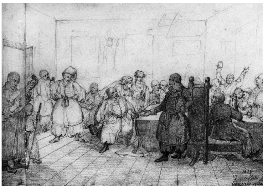
Козацький бенкет. Т.Г. Шевченко, 1838.

Усі ці страви обов'язково вживалися з вишуканими німецькими, угорськими та французькими винами, монгольською горілкою, квасом, пивом, варенухою та медовухою, різноманітними наливками. Так, Іван Самойлович любив пити катнаське вино, яке завозилося з Молдови, а Мазепа – ані-