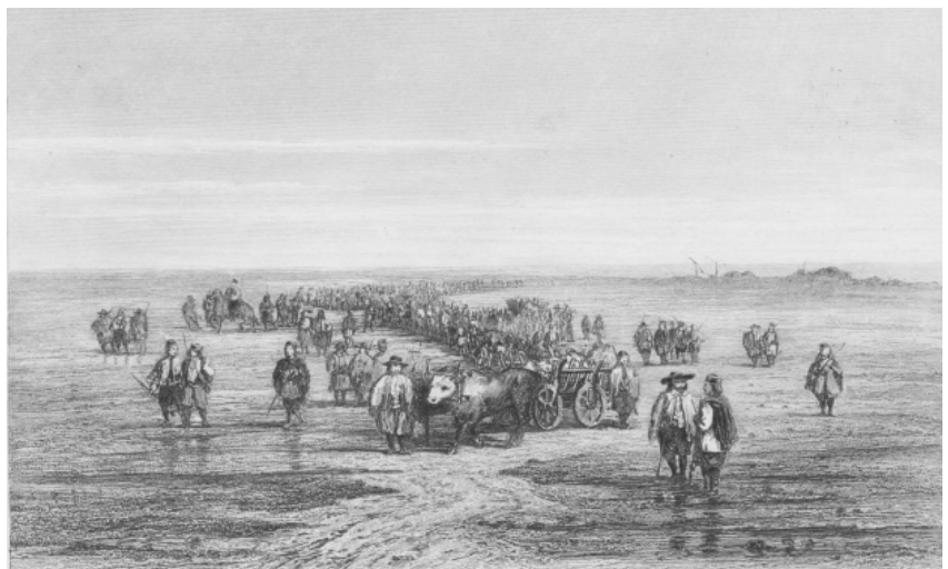
Гравюра «Молдова-Валахія». XVIII ст. НІКЗ «Гетьманська столиця».

Політична емігрантська діяльність Ф. Мировича та Ф. Нахимовського тісно пов'язана з родиною Орликів. Представники козацької нації гідно представляли Україну в європейських державах. Хоча їх діяльність не зумовила кардинальних зрушень щодо українського питання, російський двір зав-