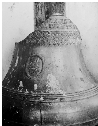
Дзвін Троїцької церкви Батурина, 1770 р. Фото 1930 р. ІР НБУВ, ф. 278, № 651, фото 9.

ні талії в овальному віночку вміщено відомості про майстра: «лил сей // колокол // мастер // Петр Ром//ановски»; в 3-х картушах – рельєфні зображення Святого Миколи, Святого Михайла та Богородиці.