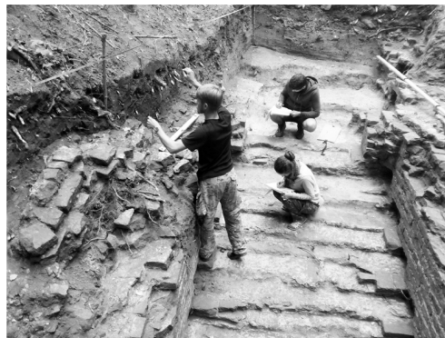
Дослідження заміської резиденції Івана Мазепи в Батурині. Фото автора, 2019 р.

Ще один об'єкт розкопок 2019 р. знаходився на території заміської резиденції Івана Мазепи. За роки досліджень цієї садиби було виявлено і вивчено кам'яний палац, дерев'яні «покоюву хату» (флігель), курінь-вартівню, церкву. Довгий час западина перед палацом вважалася рештками колодязя. В минулому році під час розвідки на краю котловану було знайдено цегляну кладку. Вивчення щойновиявленого об'єкта під керівництвом молодшої наукової співробітниці Інституту археології НАН України