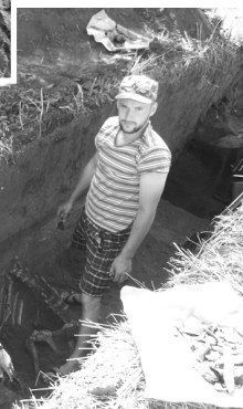
Дослідження на території поселення Дорога. Фото автора, 2019 р.

Л. Мироненко в цьогорічному сезоні було продовжено. Під час досліджень вдалося з'ясувати, що це підвальне приміщення наземної споруди, можливо, господарського призначення. Археологи виявили вхід до підвалу. До нього вели дерев'яні двері. Було розкопано сходи та ніші в стінах на сходовій ділянці. Було встановлено, що кладка з цегли мала товщину близько 90 см, а підвал був частиною забудови садиби І. Мазепи. Сама садиба припинила своє існування у 1708 р., але підвальне приміщення збереглося. Воно використовувалося за призначенням ще й у той час, коли цією територією володів бджоляр Степан Великдан (син П.І. Прокоповича). Видовжену яму довжиною в три сажні і шириною трохи більше сажня поблизу решток фундаментів гетьманського палацу згадували очевидці в кінці XIX ст. На новому об'єкті було знайдено багато полив'яних та теракотових рельєфних кахлів, фігурної плитки з підлоги палацу гетьмана І. Мазепи. Серед знахідок привертає увагу фрагмент цегли із відбитком лапи собаки.