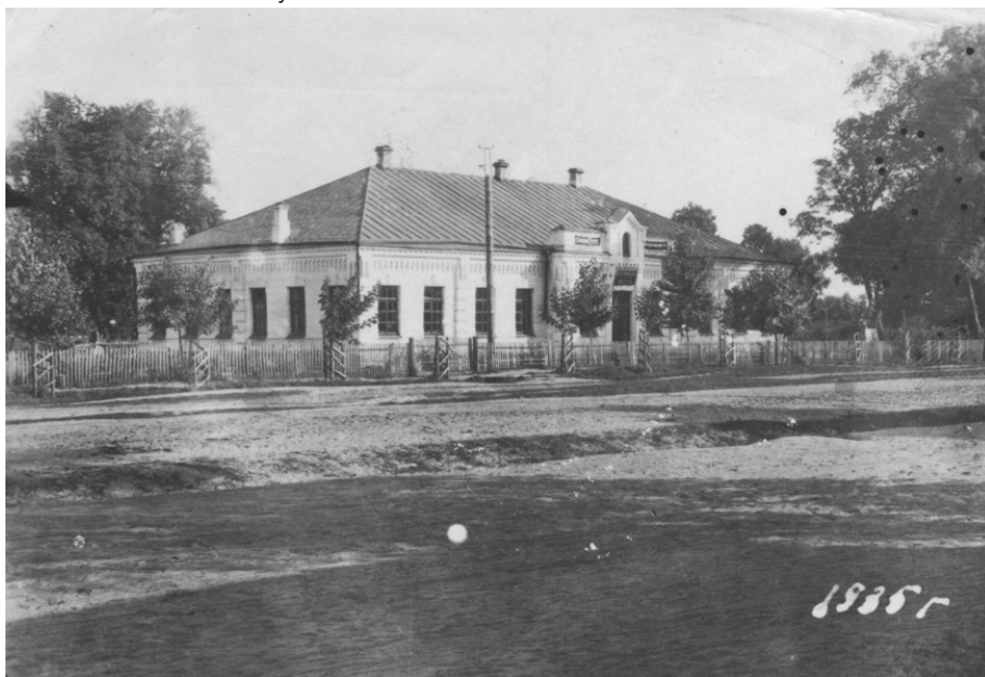
Двокласна школа Міністерства народної освіти в м. Батурині (Училище ім. М.Ф. Затворницького). Фото 1935 р.

Зі сторінок «Ради» дізнаємося, що в Батурині на той час працювали ще дві школи грамоти при церквах: «в Батурині при церквах Воскресенській та Покровській існує ще дві школи грамоти. Обидві вони кам'яні, збудовані років з 4 тому. Витрачено на їх будівлі коло 12000 карб. Але з цього року селяне майже зовсім од них одцурались, бо за вчення дітей беруть гроші (по карбованцю від учня), а учать так, що по скінченню школи учень не має спромози й підписати свого прізвічка тоді, як по земських таких випадків не трапляється й учать без грошей. Цього року в обох цих школах, не зважаючи на те, що помешкання більше ніж на 200 душ, вчиться всього на-всього 15 учнів. Через це попечитель нової школи, старшина Стокоз та член повітової управи Л., жаліючи тих дітей, які zostалися поза школою й не бажують іти в школу грамоти, зробили пан-отцям пропозицію передати обидві школи грамоти земству з тим, щоб для них було призначено вчителів