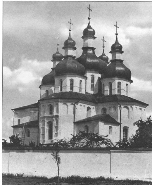
Миколаївський собор Батуринського Микола-Крупицького монастиря.