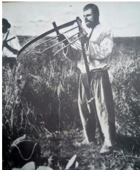
Косари під час збирання урожаю. Батурин. Фото 50-ті рр. XX ст.