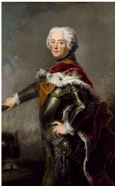
Портрет Фрідріха II Великого. Художник А. Песне, 1736.

Зараз з'являється усе більше досліджень про схожість політик українських та європейських діячів, проте їх прогресивні та модерні погляди проявлялися не лише в публічній та політичній діяльності. У даній статті проаналізовано приватні бібліотеки двох яскравих європейських правителів: українського гетьмана Кирила Розумовського та короля Пруссії Фрідріха II Великого. Особиста бібліотека є важливим джерелом відомостей про сферу інтересів, літературних смаків, дружніх