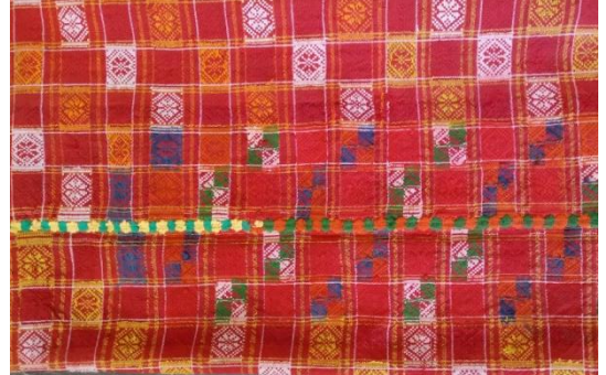
Плахта жіноча, кінець XIX ст. З фондівого зібрання Національного заповідника «Гетьманська столиця»

ним та геометричним орнаментами. Здебільшого рушники прикрашені мереживом ручної роботи. Особливий інтерес становлять кролевецькі рушники, понад 50 одиниць зберігання. Кролевецьке ткацтво відоме ще з XVIII століття, найбільшого розвитку та поширення набуло у XIX – на початку XX століттях у період розквіту Хрестовоздвиженського ярмарку в місті Кролевець Чернігівської губернії (нині – Сум-