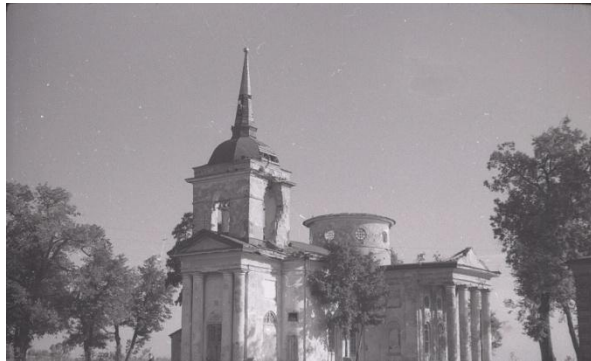
Воскресенська церква Батурина, 1947 р.

ла Розумовського. Відтак, в ході цих заходів, ймовірно, були зроблені і знімки Воскресенської церкви. Але відновлення сакральної архітектури не було першочерговим завданням влади. У 1950 р. ініціатором ремонту храму вступила