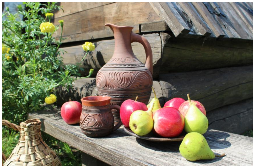
У експозиційному просторі музейного комплексу "Козацький двір", 2023 р.