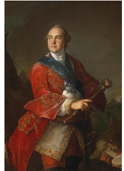
Портрет Кирила Розумовського. Художник Л. Токе, 1758.

турина. Ця частина книгозбірної має особливе значення, адже саме Батурин був столицею Української держави, де