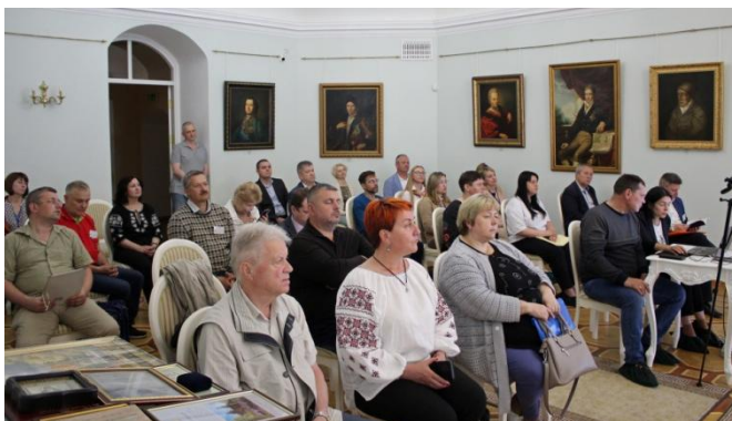
XVIII Батуринські читання. Пленарне засідання

Загалом розповіді фахівців з різних куточків України засвідчили, що сьогоденні музеї є не лише об'єктами атак, а й суб'єктами процесу визвольної війни. Наше спільне завдання – вибороти ПЕРЕМОГУ!