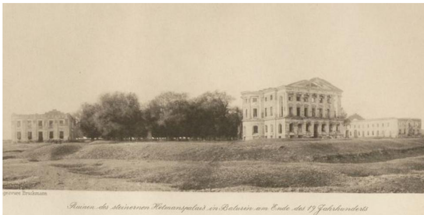
Палацово-парковий ансамбль Кирила Розумовського. Кінець XIX ст.

Написані та видані Камілом Розумовським праці розкривають маловідомі сторінки життя представників гетьманської родини та є цінним джерелом для вивчення її минулого.