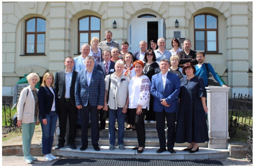
Учасники XVIII Батуринських читань, 14 червня 2023 р.

В ході Читань було презентовано нове видання заповідника – бібліографічний покажчик «Науковий доробок Національного історико-культурного заповідника «Гетьманська столиця». Укладений істориками закладу, він містить бібліографію праць його співробітників за 1997–2022 рр., бібліо-