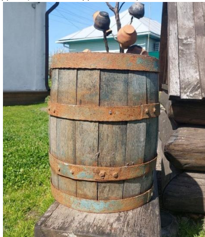
Бочка для пива. Експозиція Музейного комплексу «Козацький двір». Національний заповідник «Гетьманська столиця».

Настоянки готуються довше. Для їх виготовлення брали переважно вишні, аличу, абрикоси або сливи-«венгерки». Сулію або банку потрібно засипати ягодами, які вам подобаються, «по самі ви-