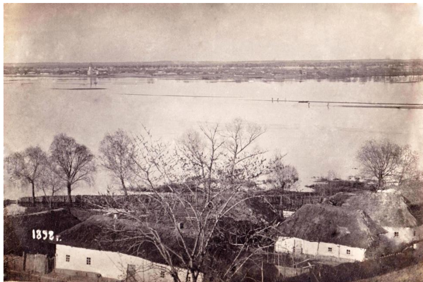
Батурин, 1898 р.

Офіційною датою винаходу фотографії вважають 1839 рік. За більш ніж 180 років змінилися технології і способи виготовлення фотографій, але не змінилося бажання людини зупинити мить, тому фотографія міцно увійшла у повсякденне життя суспільства. Вона відіграє важливу роль у поширенні знань і культури. Однією з найцінніших функцій фотографії є фіксація історії.