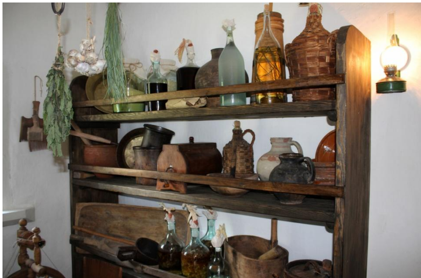
Експозиція Музейного комплексу «Козацький двір». Національний заповідник «Гетьманська столиця».

Ще з гетьманських часів популярним у Батурині й вживання пива, яке виготовляли з ячменю, хмелю й солоду, іноді з ячмінно-просяної суміші. Ремісники-пивовари звалися броварями,