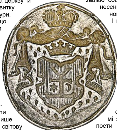
Печатка із зображенням князівського герба Івана Мазепи.

Самопали набивайте, Острих щабель добувайте, А за віру хоч умірте, І вольностей бороніте! Нехай вічна буде слава, Же през шаблі маєм права!