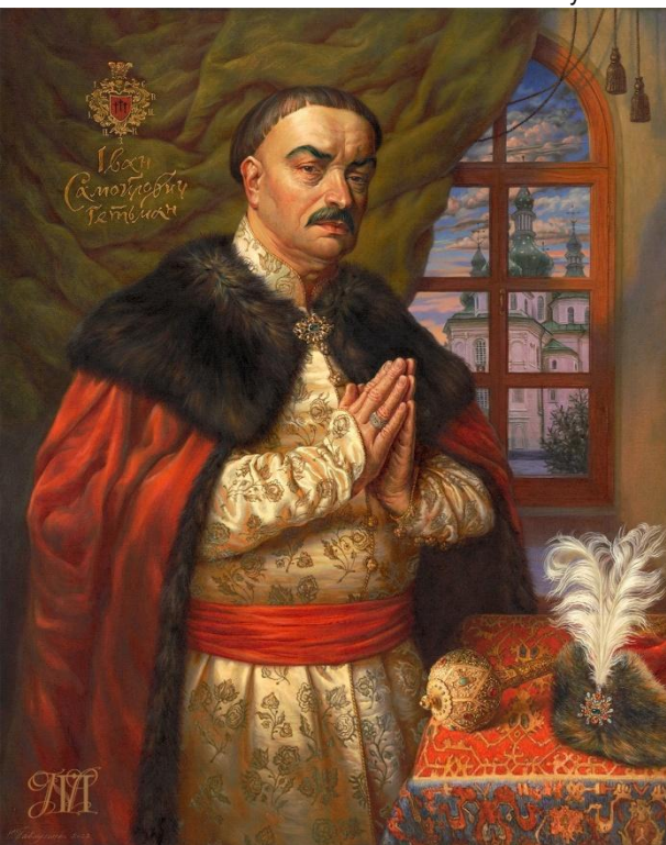
Гетьман Іван Самойлович. Наталія Павлусенко, 2022 р. Зібрання Національного заповідника «Гетьманська столиця»

цьовують досвід відтворення об'єктивного образу та зовнішнього вигляду історичних постатей. Спільно із фахівцями Київського музею воскових фігур було здійснено реконструкції зовнішностей 15 очільників Гетьманщини. На думку дослідників, для створення сучасних зображень гетьманів варто використовувати не лише прижиттєві портрети, а й усю силу творчої уяви, яка здатна відтворити образ цієї особистості виходячи з фактів та подій його біографії. Аналізуючи збережені портрети гетьмана Самойловича та виконуючи запит заповідника, Наталія Павлусенко успішно втілила спільний задум