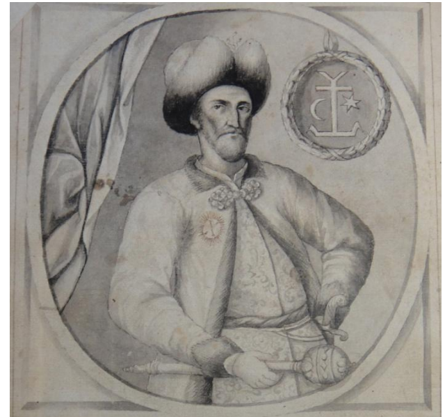
Гетьман Іван Мазепа. Самійло Величко, «Літопис», 1720 р.

Цей період характеризувався економічним розвитком країни, стабілізацією соціальної ситуації, піднесенням церковнорелігійного життя та культури.