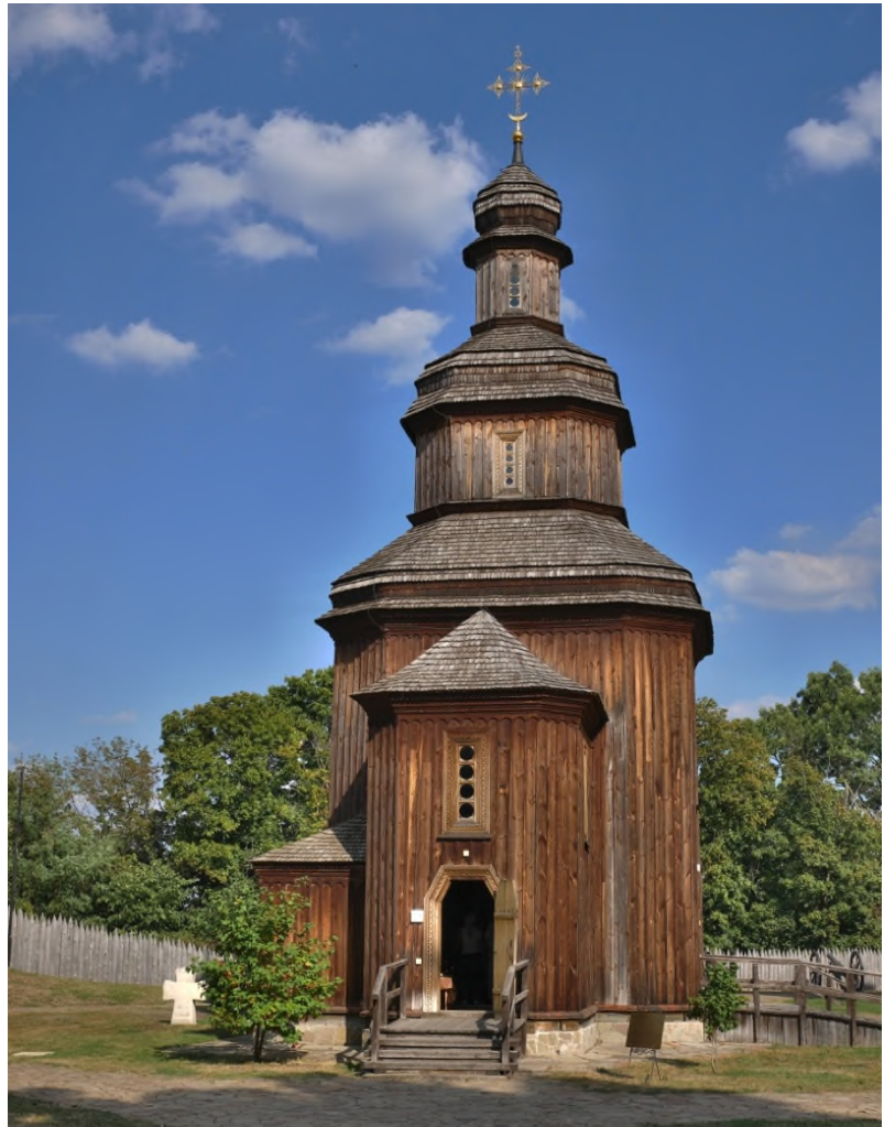
Відбудована церква Воскресіння Господнього на Цитаделі Батуринської фортеці. Фото 2018 р.

Який вигляд мала батуринська замкова церква? Можемо припустити, що вона була споруджена у тогочасних традиціях і належала до так званого «баштового» типу. Такі храми повторювали архітектуру зрубних оборонних башт і їхнього накриття. Найпевніше, у