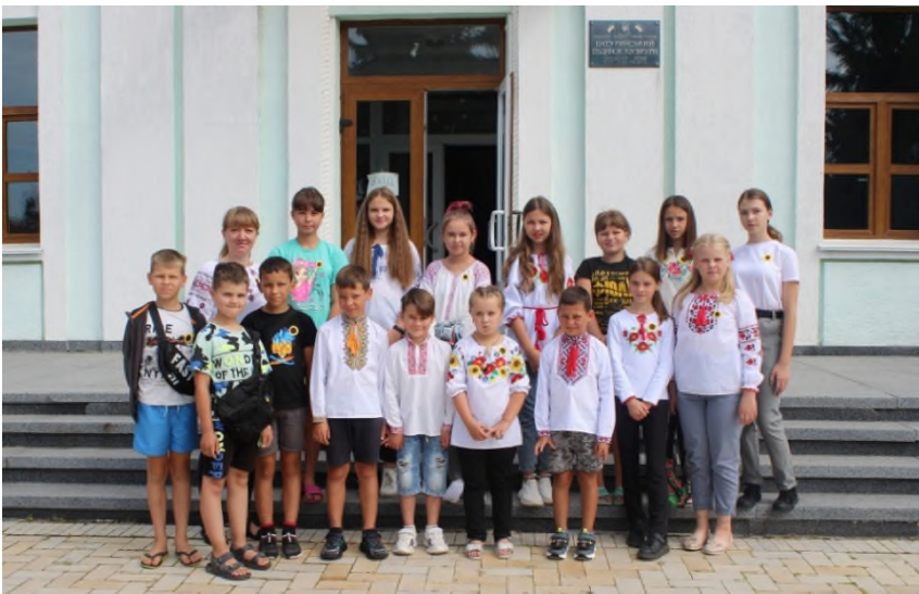
Культурно-просвітницький захід «Пам'ятаємо! Віримо! Переможемо!», 2022 р.

Отже, з радістю можемо констатувати, що, попри все, одна з головних цілей історичного гуртка «Батуринський канцелярський курінь» – виховання молодого покоління як свідомих громадян України, нами успішно реалізовується! Кожне заняття, кожна тема має значний патріотично-виховний потенціал, який формує впевненість в собі, віру в Перемогу, у свою націю, в свою Україну!