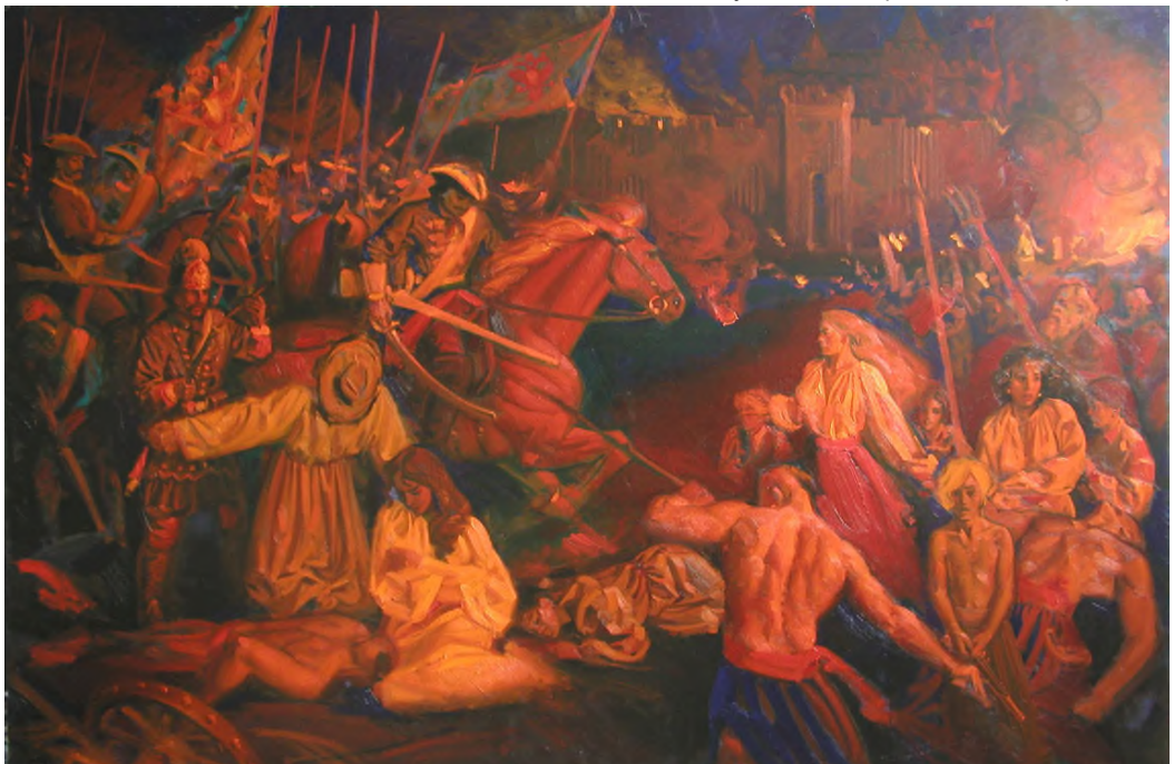
Івахненко А. «Різня в Батурині 1708 року», 2000 р. Зібрання Національного заповідника “Гетьманська столиця”

Зараз, коли Україна мужньо відбиває багатотисячну фашистсько-російську навалу, схиливши голову у жалобі по мужнім оборонцям та мирним жителям Батурина, що загинули у гіркому листопаді 1708 р., ми згадуємо також мужніх крутіців, петлюрівців, бандерівців, тисячі закатованих сталінським терором та замордованих голодоморами, шестидесятників, Героїв Небесної Сотні, Кіборгів, Азовців, Титанів, що захищають Бахмутський напрям і кожного українця, хто сьогодні своїми справами наближає велику Перемогу світу над силами рашистської темряви.