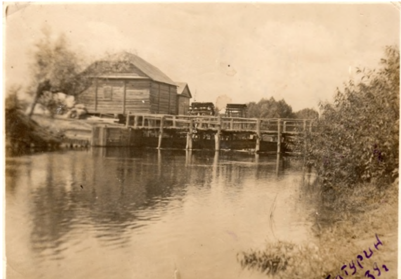
Млин на лівому рукаві р. Сейм. Фото 1939 р.

Поштовхом до розвитку млинарства був швидкоплинний Сейм. З XVII ст. на його швидких течіях почали будувати водяні млини. Особливий розвиток млинарства в Батурині припадає на часи гетьманства. Так, за гетьмана Івана Мазепи (1687-1708) їх налічувалося 33, а при Кирилу Розумовському (1750-1764) – 44 разом з валюшнями. Продовжив своє функціонування млинарський промисел як згадують місцеві старожили і в XX ст.