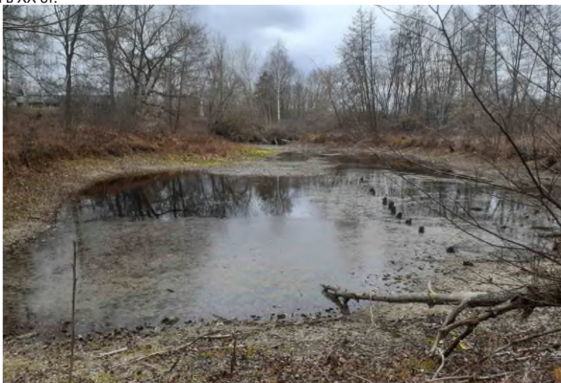
Залишки дубових паль від млина на лівому рукаві р. Сейм. Фото 2021 р.

В кінці 1952 р. водяні млини припинили свою діяльність у зв'язку з появою електродвигунів та будівництвом промислових млинів, а в наш час водяні млини замінили потужними борошномельними заводами.