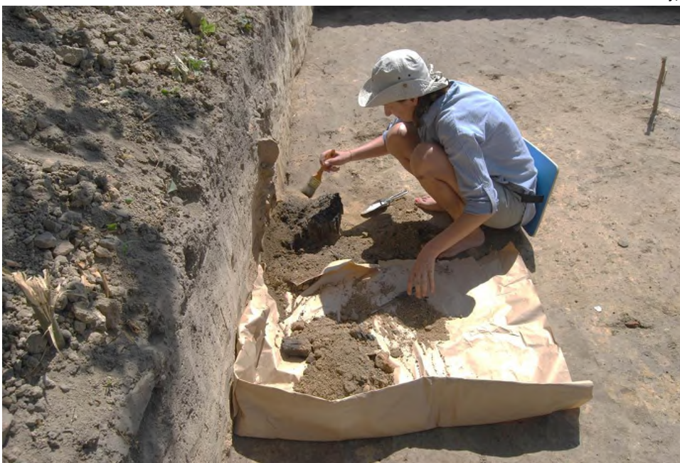
Археологічні дослідження садиби Пилипа Орлика. Фото 2018 року.

Наразі садиба Пилипа Орлика є надзвичайно важливою для історичної науки. Дослідження цієї пам'ятки вимагає від працівників Національного заповідника і учасників Батуринської археологічної експедиції не лише професіоналізму, але й ставить завдання пошуку фінансування проєкту. Раніше розкопки обмежувалися ділянками приватної садиби, тому поки що вивчено близько 30% пам'ятки. Щиро віримо, що її подальше дослідження обов'язково продовжиться.