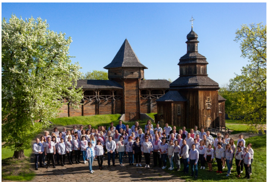
Колектив Національного заповідника «Гетьманська столиця», 11 травня 2021 року

У січні 2021 р. на базі заповідника для наукових співробітників закладу пройшло особливе навчання від одного з кращих фахівців України цього напрямку, доцента Державної екологічної академії післядипломної освіти та управління Наталії Гудкової на тему «Мистецтво інтерпретації природної та культурної спадщини». Це дозволило реалізувати отримані знання у новій інтерпретованій екскурсії «Таємниці садиби Кочубеїв» у Будинку генерального судді Василя Кочубея та у першому на Чернігівщині інтерпретаційному музейному комплексі «Козацький двір». У вересні для музейних доглядачів заповідника визнаний фахівець з музейної комунікації Ольга Зайченко провела тренінг на тему «Бути обличчям та душою музею». Він дозволив по новому поглянути на кінцеву мету своєї роботи, оцінити важливість професії та її роль у забезпеченні злагодженої роботи закладу. У листопаді наші працівники стали учасниками навчального семінару на тему «Робота з відвідувачами з порушенням зору та слуху», на