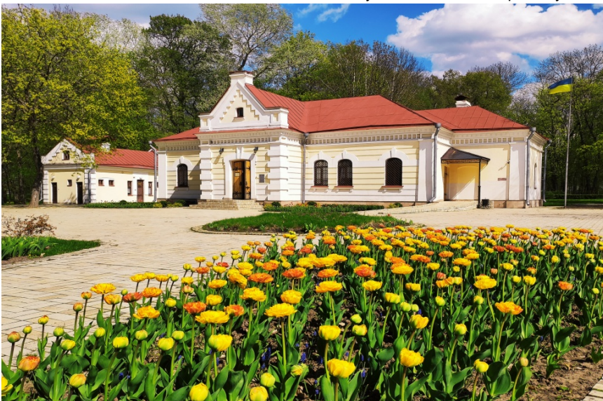
Будинок Генерального судді Василя Кочубея. Фото 2021 р.

Заповідник має в користуванні на території Батуринської об'єднаної територіальної громади десять земельних ділянок загальною площею 32 га. Вони є обличчям нашого заповідника і окрасою Батурина. Важливо, щоб кожен розумів, що все утримання цих територій, які завжди охайні, покошені, уквітчані, облаштовані зонами відпочи-