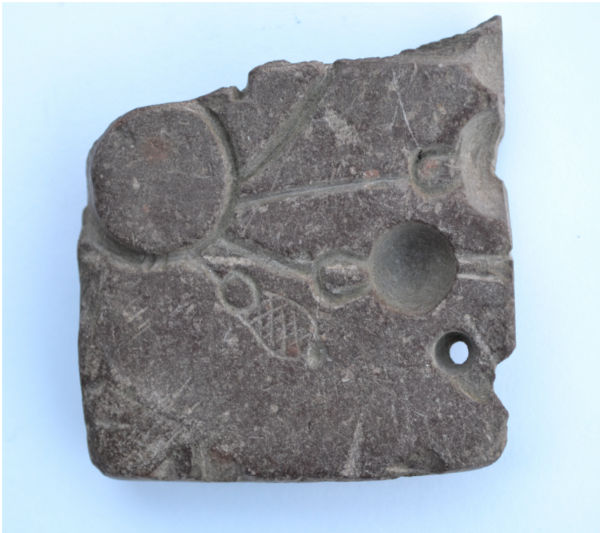
Фрагмент двобічної ливарної форми XI–XIII ст. з овруцького шиферу. Випадкова знахідка. Передано Іриною Лобовик в 2006 р.

Вилучений із землі предмет назавжди втрачає свою наукову цінність. Але, разом з тим, випадкові знахідки, що потрапили до музейних зібрань і пройшли етап наукової атрибуції, є важливим джерелом історичного знання. Прикладом цього є археологічна колекція Національного заповідника «Гетьманська столиця».