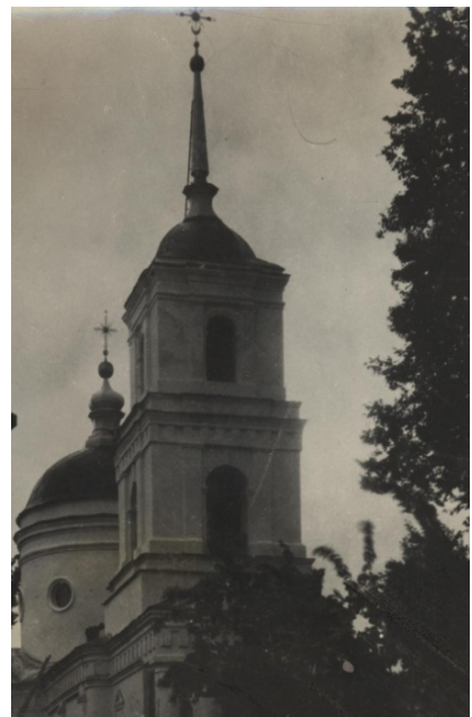
Покровська церква. Фото початку XX ст.

Отже, історія церкви Покрови Пресвятої Богородиці має ще багато недосліджених сторінок. Однак архівні документи дозволяють крок за кроком відкривати сторінки її минулого.