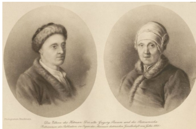
гетьмана, часи Григорій та Наталія Розуми президентства Кирила Григоровича в Імператорській академії наук і мистецтв у Санкт-Петербурзі, період гетьманст-

Досить цікавим є ілюстративний матеріал, що презентує різнобічні аспекти життя гетьмана та представляє собою портрети, фотознімки місцевостей, пов'язаних з Розумовськими: різні пам'ятки, родове дерево. Привертають до себе увагу портрети батьків гетьмана – Григорія та Наталії Розумів, Кирила Розумовського і Катерини Нарішкіної в момент укладання шлюбу, синів та дочок гетьмана: Олексія, Петра, Андрія, Лева, Івана, Григорія, Наталії, Ганни, Єлизавети. Не менш цінними є знімки та зображення села Лемеші,