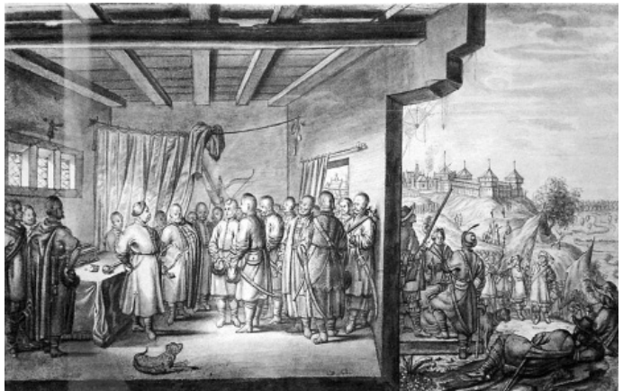
Зустріч Янушем Радзивілом посланців Бодана Хмельницького. Художник Абрагам ван Вестерфельд, 1651 рік.

Також безпідставно агресивну політику Московії відзначав ще в першій половині XVIII ст. і член уряду Ганновера барон Гакстгаузен, що московити ледь не єдиний агресор, який ніколи не потребував ні сполучання, ні геніальних керманів, і захоплював чужі території, не потребуючи в цьому видимої необхідності.