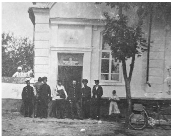
Будівля батуринської пошти. 1910 р.

Кожна поштова станція, що підпорядковувалася Головному управлінню пошт і телеграфів, незалежно від розряду, для організації перевезення пасажирів поштовими кіньми користувалася законодавчими документами XIX – початку XX ст., які друкувалися в типографії Міністерства Шляхів Сполучення в Санкт-Петербурзі. Робота поштових станцій була злагодженою, системною, спрямованою на задоволення потреб держави та її громадян.