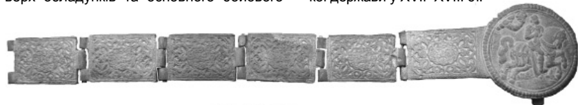
Фрагмент посрібленого бронзового пояса XVII ст. Музей археології Батурина. Фото Олександра Терещенка, 2020 р.

Отже, ці елементи козацького спорядження потребують подальшого детального дослідження. Деталі козацького одягу дозволяють відтворити зовнішній вигляд козацької старшини і показують розвиток декоративно-ужиткового мистецтва козацької держави у XVII–XVIII ст.