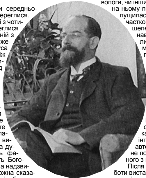
Василь Петрович Кочубей (1868–1940). Фото 1906 р.

Однак, протягом наступних буремних десятиліть, під час переміщення музейних колекцій, більшість з них були втрачені назавжди. Загубилися в історії і реліквії Василя Петровича Кочубея, передані ним з батуринської садиби.