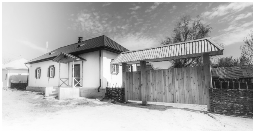
Музейний комплекс «Козацький двір», 2021 р.