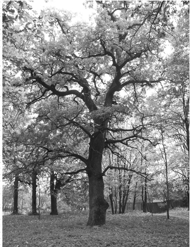
Багатвіковий дуб на території парку «Кочубеївський». Фото 2018 р.

Багатвікові дерева — також об'єкти охорони держави. На відміну від кам'яниць, скульптур чи археологічних решток вони живі, тому потребують щоденного догляду, лікування за новітніми технологіями. Саме ці завдання успішно виконують працівники паркових відділів НІКЗ «Гетьманська столиця».