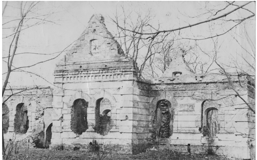
Будинок В. Кочубея, 1949 р.