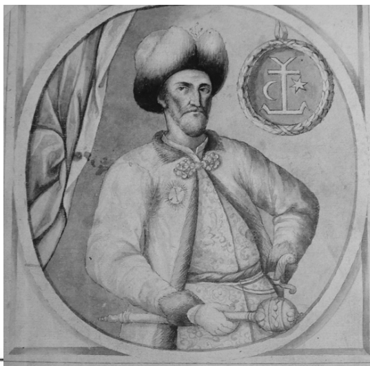
Іван Мазепа (1639–1709). Портрет з «Літопису» С. Величка.

під час закладу, організованого Петром I з метою відсторонення від влади своєї сестри Софії, тодішньої правительки Московії. А чаша терезів остаточно схилилася на бік молодого царя якраз після того, коли гетьман прибув до Троїце-Сергієва монастиря – тимчасової резиденції Петра I. В умовах хоч і короткочасної, але все ж дезінтеграції структури