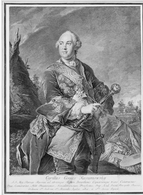
Портрет гетьмана К. Розумовського. 1762 р. Георг Шмідт з оригіналу Л. Токе 1758 р.

Кирило Григорович залишився в історії України одним із найславніших її синів і патріотів, видатним державним і політичним діячем XVIII ст. Своєю державницькою і реформаторською діяльністю він зробив значний внесок у відродження Української незалежності та відродження міста Батурина.