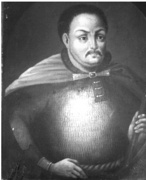
Портрет гетьмана І. Самойловича. Невідомий художник. Середина XIX ст. Національний музей історії України.

В роки управління Івана Самойловича продовжився процес приєднання Київської митрополії до Російської православної церкви. Релігія для гетьмана відігравала важливу роль об'єднавчого чинника українського народу, доводила правомірність існування української держави, що в тих умовах було необхідним для збереження гетьманського управ-