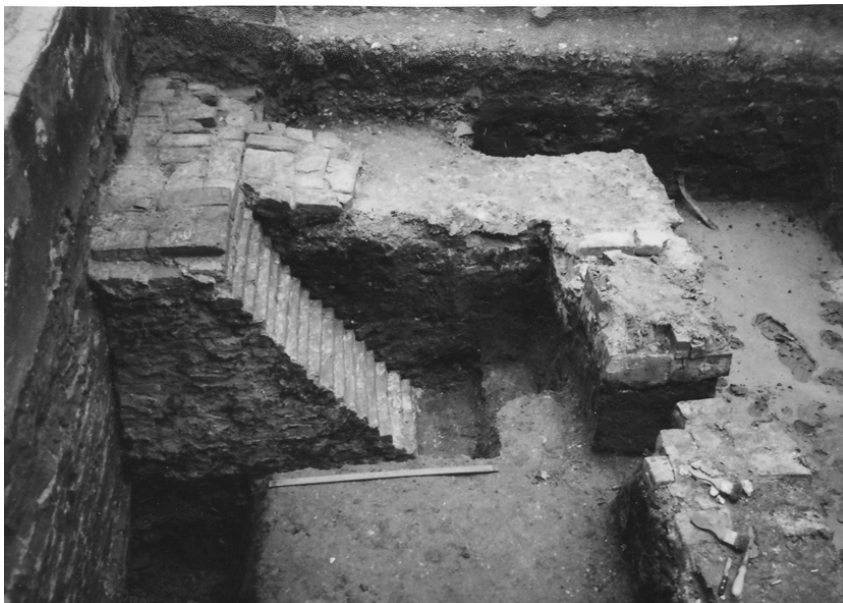
Контрфорс біля східної стіни будинку В. Кочубея.

ність генерального суду Лівобережної України пов'язана з цією спорудою. Після Василя Леонтійовича кілька десятиліть садибою і будинком володіли