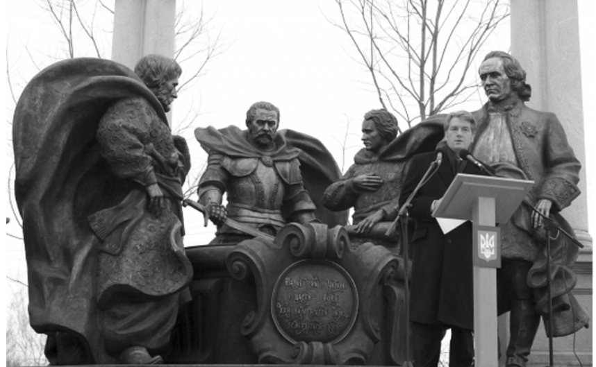
Офіційний візит Президента України до Батурина, 22 січня 2009 р.

Те, що зробив Путін за останні п'ять років, — трагедія не тільки України. Він своїми діями ізолює Росію, а в ХХІ сторіччі жи-