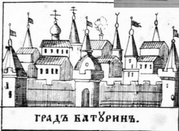
Міто Батурина. Лубок початку XVIII ст.

Коли співіснування з Москвою стало абсолютно нестерпним, гетьман Мазепа підняв повстання проти царя. І підняв це повстання виходячи виключно з інтересів українського народу. Врешті, навіть сухий перелік всіх досягнень Івана Мазепи за 22 роки гетьманування зайняв би не один десяток газетних сторінок – успіхів справді було немало!