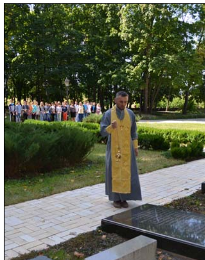
Поминальна літія, фото 05 вересня 2014 р.

тедств ім.А.Розумовського Тищенко Н.І., викладач-методист вокалу Чернігівського музичного училища ім.Л.Ревуцького Гончаренко М.А. Відгукнулися взяти участь у фестивалі 41 учасник з п'ятнадцяти спеціалізованих навчальних закладів Чернігівської і Сумської обла-