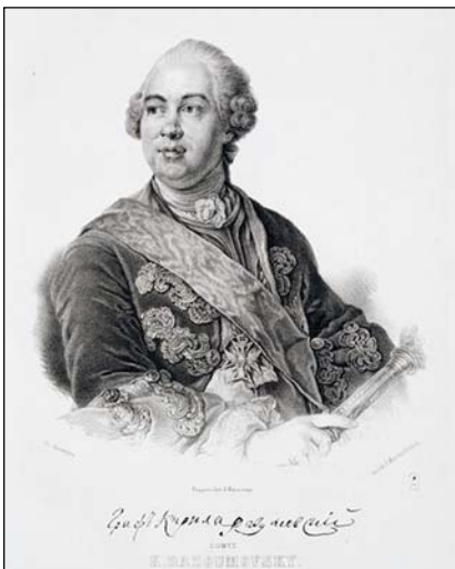
Портрет графа К. Розумовського. Невідомий літограф, 1865 р., з оригіналу Л. Токке

Кирило Григорович Розумовський - унікальна особистість XVIII ст., яка завжди привертала до себе велику увагу. Особливе місце займає постать останнього гетьмана України в мистецтві, зокрема в гравюрі. Найбільш відомим граверним зображенням Кирила Григоровича є «Портрет графа К. Розумовського»