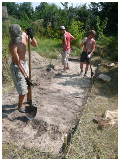
Дослідження фундаментів церкви на Гончарівці

Дослідження проводилися на замський резиденції гетьмана Івана Мазепи Гончарівці. Також були закладені розкопки на подвір'ї собору