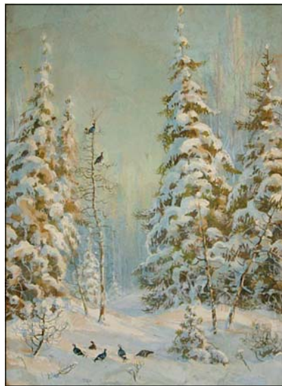
В.Муравйов. Зимовий ліс. 1910 р.

визнання серед публіки, яка захоплювалася полюванням як видом мистецтва. Серед покупців його картин були навіть особи царської родини.