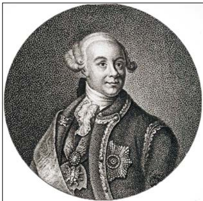
Портрет графа К. Розумовського. Гравер О. Осипов, 1838 р., з оригіналу Я. Аргунова

Російський гравер Олексій Осипов виконав три гравюри з портретним зображенням К. Розумовського. Всі вони написані з оригіналу портрета авторства Я.І. Аргунова та є ідентичними за своїм зображенням і відрізняються лише за розмірами. К. Розумовський перед нами постає в образі поважного вельможі. На портреті ми бачимо погрудне зображення К. Розумовського у вишуканому каптані, який прикрашений Андріївською зіркою. Перша гравюра виконана у 1820 р. для «Истории Малой России» Д. Бантиша-Каменського. Гравюра зберігається в Державному Ермітажі. Друга виконана в 1821 р. для «Собрания портретов россиян, знаменитых по своим деяниям, воинским и гражданским, по учености, сочинениям, дарованиям или коих имена почему другому сделались известными свету, с приложением их кратких жизнеописаний» П.П. Беке-