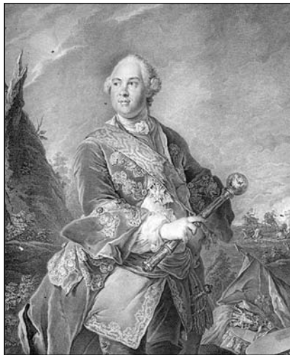
Портрет графа К. Розумовського. Гравер Г. Шмідт, 1762 р., з оригіналу Л. Токке

Г. Ф. Шмідт був одним із провідних майстрів європейського рівня, член Паризької Академії наук. У 1757 р. прусський король Фрідріх II направив його на 5 років до Санкт - Петербурзької Імператорської Академії наук і мистецтв, де він очолив гравіювальний клас. У цей час Президентом Академії наук був К. Розумовський, що в свою чергу сприяло їхньому знайомству. По закінченню контракту Г. Шмідт повернувся до