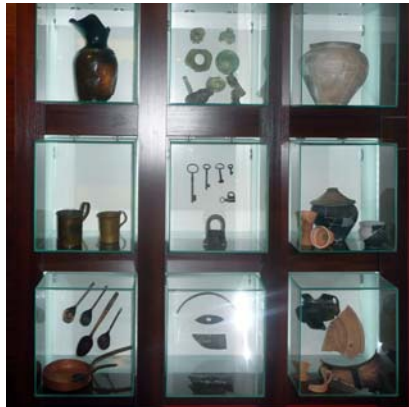
Вироби ремісників Батурина XVII-XVIII ст. в експозиції Музею археології Батурина

Виробництво одягу, взуття та інших речей зі шкіри представлено профес-