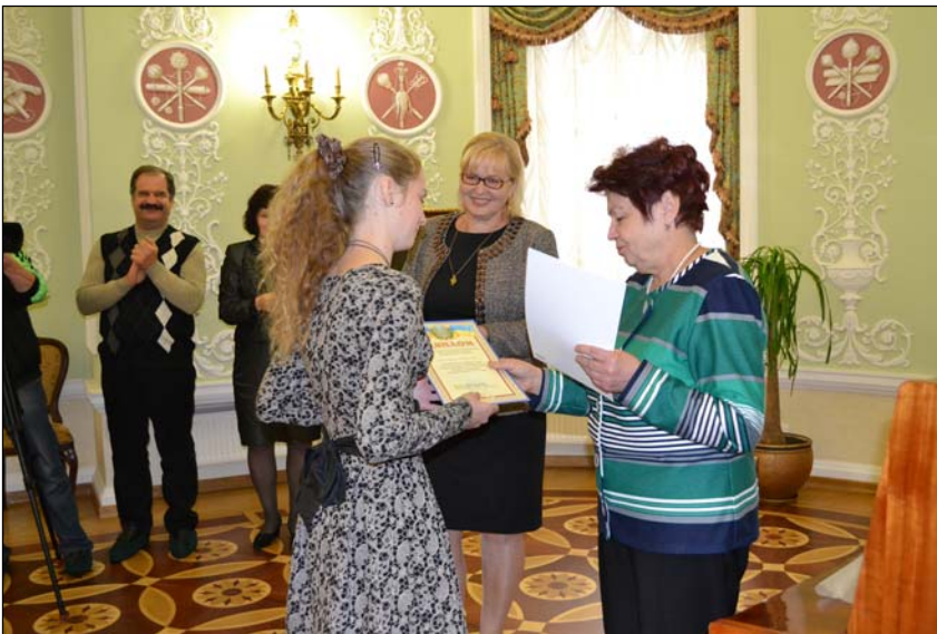
Вручення дипломів та призів переможцям конкурсу, фото 22 жовтня 2014 р.