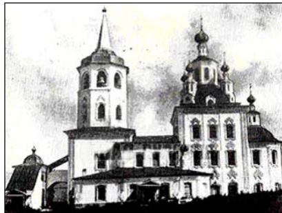
Спаський собор в Старому Селегінську. Видляд з півдня

Особа українського гетьмана Дем'яна Многогрішного є не менш тяємничою, аспекти його життя недостатньо висвітлені в науковому обігу. Відомо, що народився „опальний гетьман” в м. Коропі і походив з посполитих селян, та тяємницею лишається дата його народження: одні джерела називають 1621 р., а інші – 1630, 1631 р. Приймав активну участь у Визвольній війні українського народу 1648 – 1657 рр. У грудні 1668 р. на старшинській раді у Новгород-Сіверському обраний „Сіверським гетьманом”. 3-6 березня 1669 р. відбулася Глухівська рада, на якій у присутності московських представників гетьманство Многогрішного було підтвержене. Залишався гетьманом до 1672 р., коли звинувачений козацькою старшиною у зв'язках з Туреччиною, намірах порвати