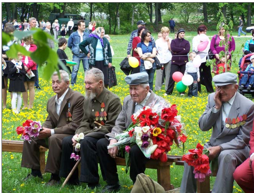
Ветерани Великой Вітчизняної війни на святі Перемого, м. Батурин фото 9 травня 2011 р.