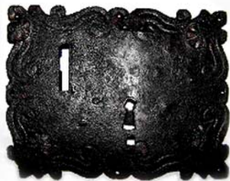
Врізний замок з будинку В.Кочубея, XVII ст.

Цікавими предметами огляду в експозиції будинку – музею В.Кочубея є ковані замки XVII –XVIII ст., які являються невід’ємною частиною історії пам’ятки архітектури XVII ст. На території садиби В.Л.Кочубея розміщувалось багато різних приміщень для замикання яких використовували замки різної форми та