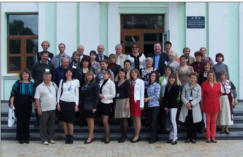
Учасники XI конференції, фото 13 травня 2011р.

Дякуємо всім учасникам конференції за їх працю, активну патріотичну позицію, адже такі конференції сприяють більш глибокому вивченню історії гетьманської столиці – Батурини, популяризації цих знань в Україні і світі, підвищенню престижу професії історика.