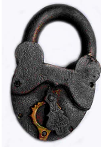
Навісний замок з садиби В.Кочубея, XVII ст.

В експозиції музею представлені декілька різних за розміром та зовнішнім