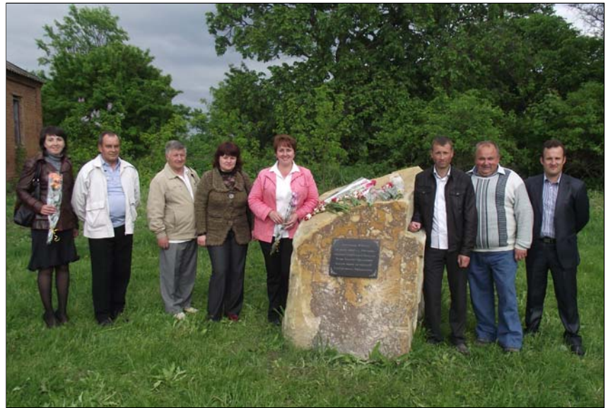
Учасники церемонії відкриття пам'ятного знаку на місці школи бджільництва П.І.Прокоповича, фото 17.05.2011р.