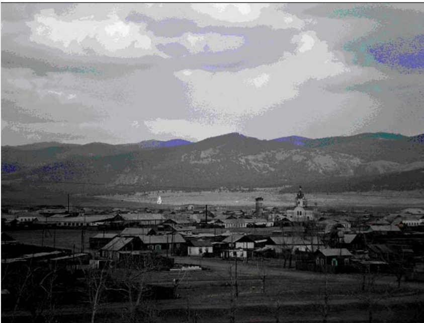
Новоселенгінськ. На задньому плані Спаський собор старого міста.

Пам'ятає про життя та діяльність Дем'яна Многогрішного і славна гетьманська столиця – Батурин.