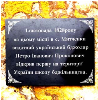
Таблиця на пам'ятному знаку в с.Митченки, фото 17.05.2011р.