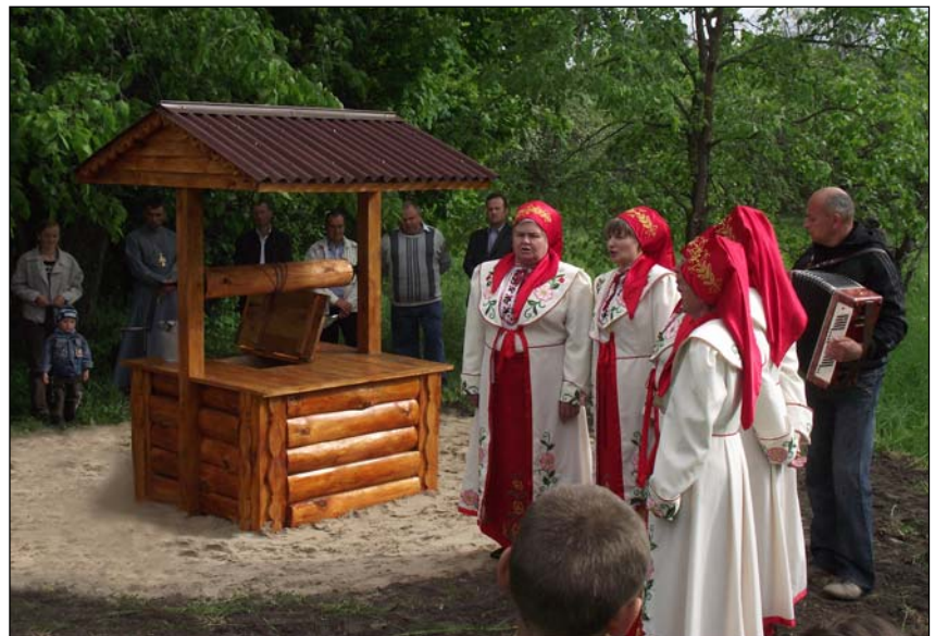
Учасники народного ансамблю «Козацька душа» виконують пісню біля відновленої криниці, фото 17.05.2011р.