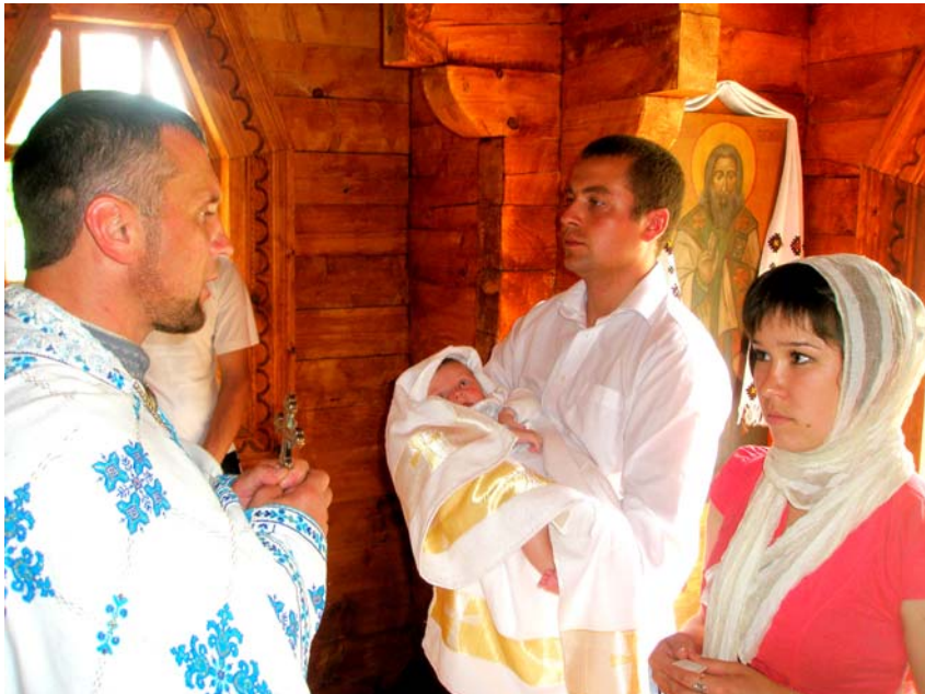
Таїнство хрещення дитини в новоосвяченій каплиці в день Св.Миколая, 22.05.2011 р.

Роботящим рукам, роботящим умам Перелогі орать, думать, сіять, не ждять І посіяне жать Роботящим рукам.