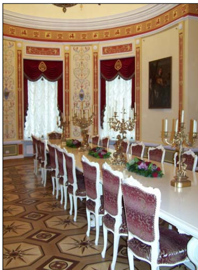
Парадна їдальня палацу К.Розумовського, фото 2009р.

Тогочасне придворне життя починає диктувати відповідні норми та правила світських прийомів. Парадні кімнати для прийому гостей оформлялись у відповідності з життям та захопленням господаря будинку. Однією з таких парадних зал в цей час стає велика їдальня.