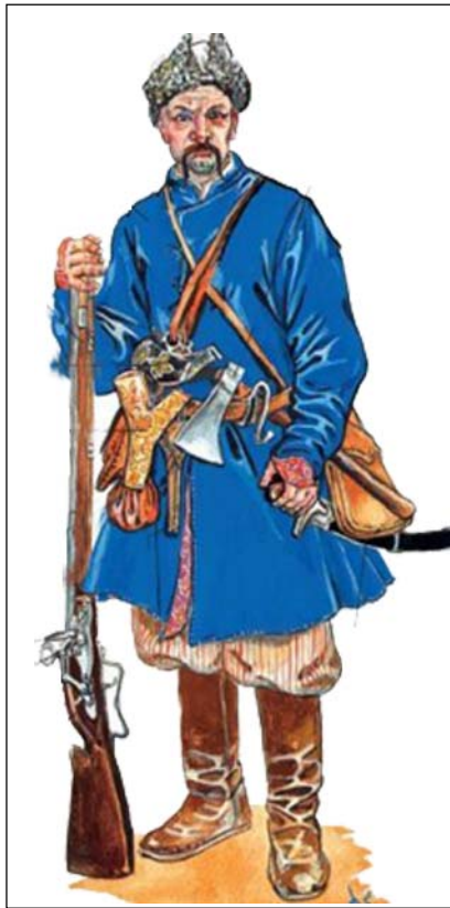
Сердюк охочепіхотного полку часів гетьмана Д.Многогрішного

Утримання найманого війська складалося з двох видів: грошового (власне жалування) та натурального (харчі, бое-