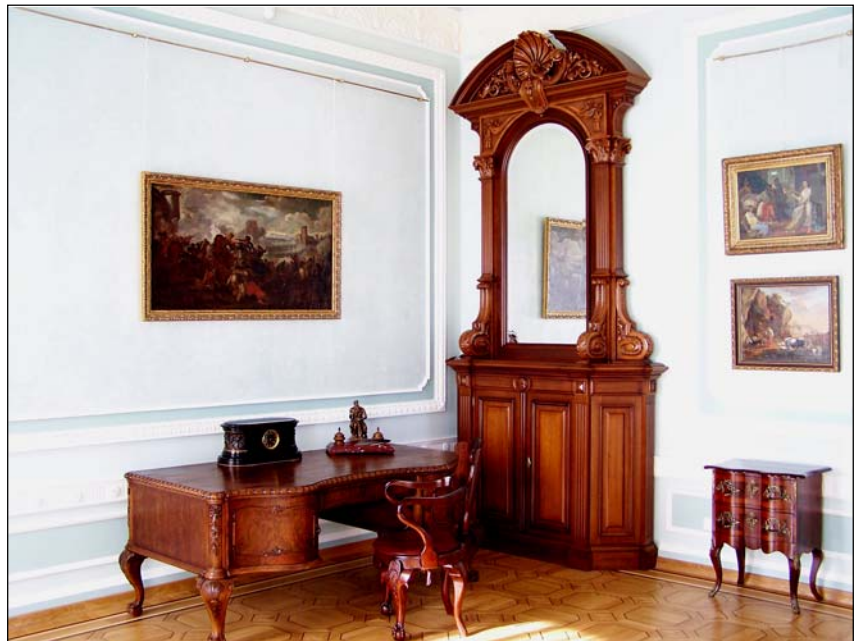
Робочий кабінет у палаці К.Г. Розумовсько, фото 2011 р.

Стіл виготовлено з горіха, оскільки деревина горіха найбільш придатна для рельєфного різьблення та поліровки. Стільниця вкрита шпоном світло-коричневого кольору. Якщо уважно придивитися, то можна помітити, що весь багатопрофільований карниз та декоративні деталі виготовлені з цільної деревини.