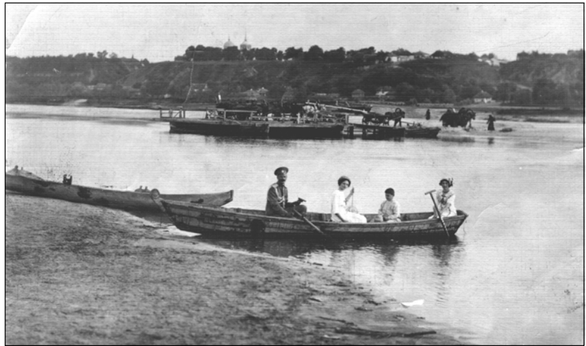
Переправа на р. Сейм з боку с. Матіївка, фото М. Боканя, початок XX ст.

Весь 1836 рік пішов на будівництво шлюзів і обвідних каналів, будинків для людей, навчених шлюзовій службі. М. Пузанов прагнув сам контролювати роботи, дивуючи виконробів, своєю несподіваною появою здавалося одночасно в різних місцях. 23 травня 1837 року Дворянські збори заслухали звіт М.О. Пузанова і визнали «за відмінні дії висловити йому подяку від імені всього дворянства і просити продовжити роботу». Весь наступний рік був присвячений остаточній доробці. У місцях, зручних для місцевих жителів, будувалися мости, береги шлюзів і каналів засівалися насінням трав і саджанцями дерев. Уздовж берега влаштовувалася дорога, по якій повинна була відбуватися кінна тяга судів проти течії. Цілом було закінчене будівництво шістнадцяти шлюзів: Лазовського, Льговського, Успенського, Стародубського, Угонського, Банищанського, Рильського, Кальтечеського, Гапонівського, Марковського, Тьоткинського, Путивльського, Клепальського, Каменьського, Батуринського і Ново-