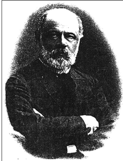
О.М. Лазаревський, (1834 - 1902)

мої”, записуючи там історичні і курйозні факти із життя України. В одному зі щоденників він записав, що гетьман України К.Г. Розумовський помер у 1803 році, похований у Батурині, в церкві Воскресіння Христового. Гробниця його була прикрашена чудовим мармуровим пам’ятником.