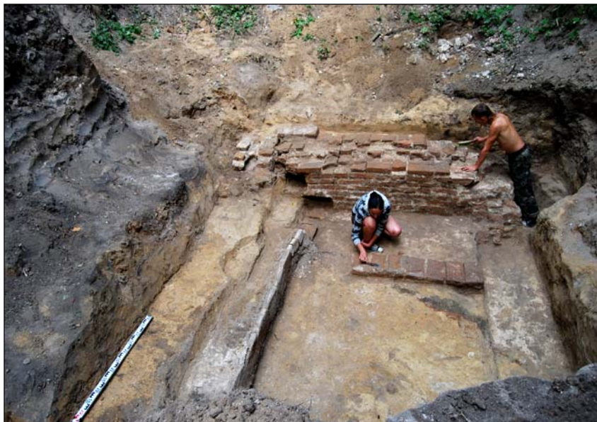
Дослідження решток палацу І. Мазепи на Гончарівці, фото, серпень 2009 р.

Завданням цьогорічних археологічних досліджень на території Троїцького собору було відкриття площі на відстані 5 метрів від стін фундаментів споруд і підготовка даної території до відбудови собору. На Гончарівці ж метою було ви-