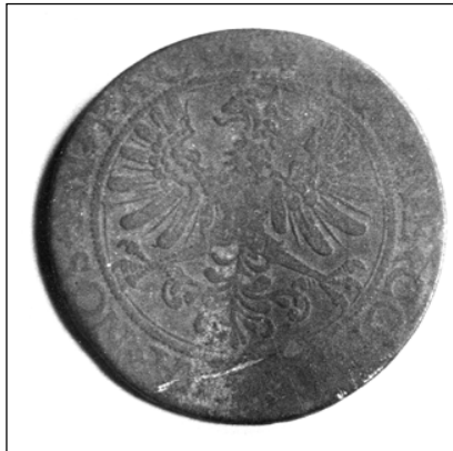
Швейцарський талер 1622 р., з колекції заповідника

Протягом XIV - XVII ст. грошове господарство Гетьманщини було орієнтоване на традиції використання західної монети. Тут в обігу були гроші різних країн: крім польських і литовських, німецькі (прусські, бранденбурзькі, люнебурзькі), шведські, голландські, австрійські, італійські, датські та ін. Оскільки до возз'єднання з Росією (1654 р.) українські землі перебували в сфері грошового обігу Речі Посполитої, де панував хаос, така сама ситуація склалася і на Лівобережжі. Хоча Російська держава прагнула викоринити іноземну монету з підвладних їй територій і замінити її власною, цей процес був досить тривалим і завершився лише в 30-х роках XVIII ст. А доти населення Лівобережжя користувалося переважно західноєвропейською монетою, головним чином карбування Речі Посполитої. Як саме здійснювали рахунок наші предки в XVII ст.? Лічили монети на золоті і копи. Зокрема, в писемних