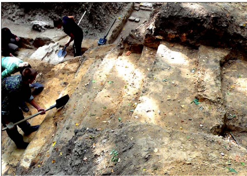
Дослідження сходів підвального приміщення палацу І. Мазепи на Гончарівці, фото серпень 2009 р.

явлення центральної осової перемички палацу І.С.Мазепи, а також дослідження решток споруди, яку було знайдено у південному напрямку від палацу.