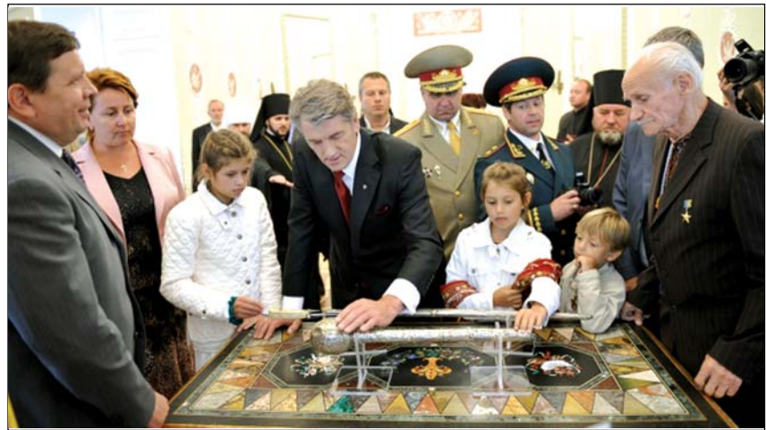
Президент України В.Ющенко з родиною і почесними гостями в залах палацу К.Г. Розумовського, фото 22 серпня 2009р.

кви Київського Патріархату Філаретом. Вони провели молебень за Україну та український народ, благословили проведення свята.