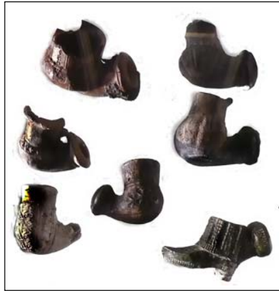
Люльки - носогрійки XVII ст. з експозиції Музею археології Батурина

розькі козаки полюбили, лежачи на животі, побалакати, послухати розповіді інших, тримаючи в зубах коротенькі люльочки - «носогрійки» або люльки - «бурульки» (від татарського слова «бурун», що означає «ніс»).