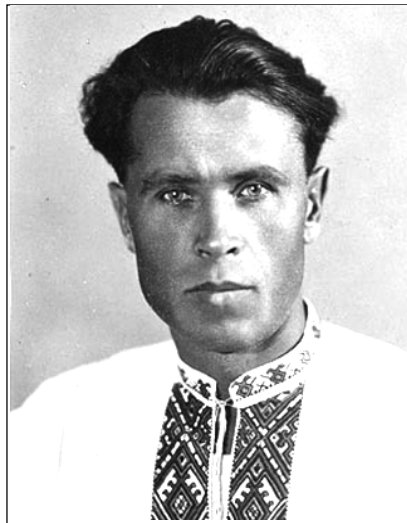
Іван Гончар, фото 60-х років ХХ ст.

В середині ХХ ст. Батурин відвідало багато відомих особистостей України. Не оминув своєю увагою Батурин і Іван Макарович Гончар, відомий, етнограф, скульптор, громадський діяч, народний художник України, засновник першого приватного етнографічного музею. В 1957р. він вирушив у поїздку з етнографічною метою по Україні. В 1966 р. відвідав Чернігівщину, побував також і у Батурині, адже не міг залишити поза увагою колишню Гетьманську столицю. Гончар зробив короткий екскурс в історію міста. На нього велике враження справило те, як стародавню гетьманську столицю жорстоко було знищено в 1708 р. російськими військами під командуванням О.Меншикова за наказом царя Петра І. Згадує І.Гончар, що про події Батурина він читав в книгах Б.Лепкого "Мотря" та М. Костомарова "Мазепа та мазепинці". Іван Макарович спілкувався зі старожителями містечка, щоб довідатися про побут та культуру батури́нців, проводив пошуки експонатів для поповнення етнографічних зібрань. А вже під час своїх експедицій він створював історико-етнографічні багатотомні альбоми "Україна та українці", в яких висвітлював самотність традицій українців та української культури. Вражений він був