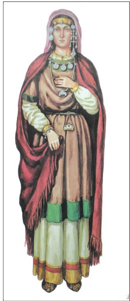
Міщанка-сіверянка XI - XII ст. в народному вбранні

З вище сказаного можна зробити висновок, що прикраси з експозиції музею археології безперечно засвідчують про міський статус нашого міста, давньорусь-