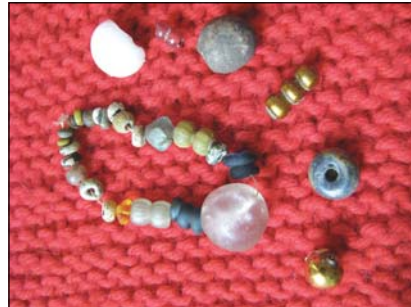
Намисто Київської -Русі з експозиції Музею археології, фото 2009р.

"штучні перла" – ці дрібні круглі або гранчасті намистинки (в діаметрі до 3 мм) з отворами були широко вживані у Київській Русі. Ще до категорії ранніх належить біла матова намистина середнього розміру й зелена маленька. До пізнішого часу можна віднести жовту прозору з гранями намистинку і масивну біло-молочну. Особливістю цієї колекції полягає в її відносній нечисельності, а також відсутності джкоподібних намистин цього періоду, які час-