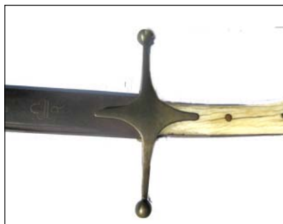
Ефес польської шаблі XVIII ст. з експозиції музею археології Батурина

"Нехай вічна буде слава, же през шаблю маєм права."