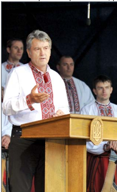
Президент України В.Ющенко на церемонії відкриття Всеукраїнського фестивалю кобзарського мистецтва

На святково прибраній сцені зібralися представники Всеукраїнської ради церков і релігійних організацій на чолі з Предстоятелем Української православної цер-