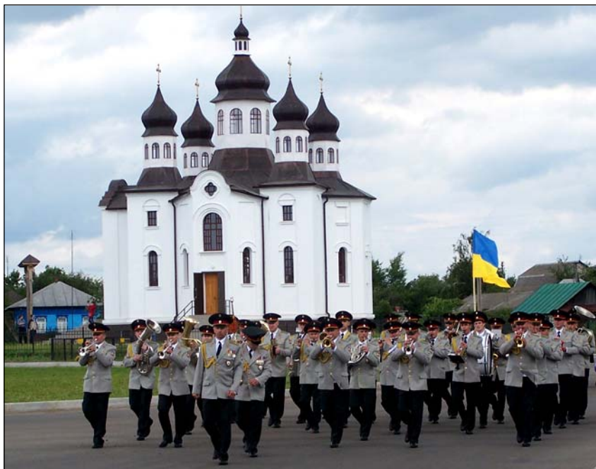
Дефіле оркестру військово-музичного центру Сухопутних військ Збройних Сил України по центральним вулицям Батурина, фото 14 червня 2009р.