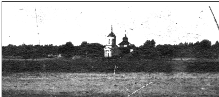
Церква Іоанна Богослова с. Матіївка, фото 1908 р.

Велика заслуга С.К.Беглевського у вихованні підрастаючого покоління батуричів знайшла свій відгук в існуючій тоді владі, яка заснувала одну стипендію імені Беглевського при Чернігівській губернській земській фельдшерській школі. Ця школа давала середню медичну освіту. Кожного року до Чернігова на навчання направляли одного із кращих учнів Батуричської волості. Після закінчення навчання в фельдшерській школі і отримавши диплом, вдячний учень повертався до своїх земляків, які з нетерпінням чекали молодого спеціаліста.