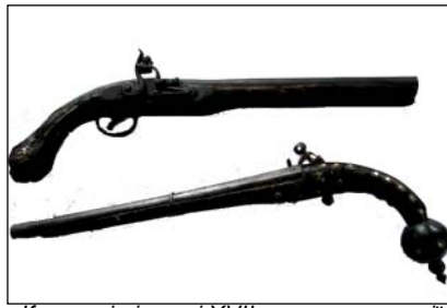
Козацькі пістолі XVII ст., з експозиції Музею археології Батурина, фото 2009 р.

науковий співробітник заповідника „Гетьманська столиця”