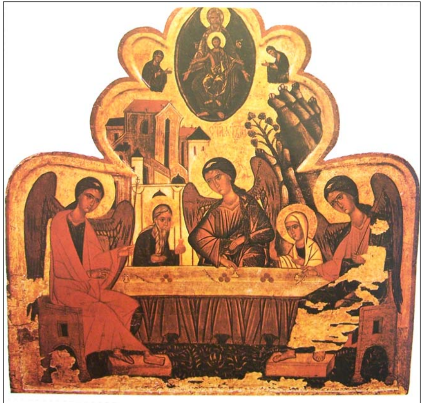
Ікона "Свята Трійця", Холмська школа XVI ст.

За описом 1654р., перший храм Живоначальної Трійці на батуринській землі постав ще у першій половині 17 ст., і знаходився він у чоловічому монастирі "за городом Батурином, в Слободе". Згодом у самому місті на території Фортеці з'являється головний мурований храм гетьманського Батурина - Трійцький собор. Довжина храму 39 м, ширина – 25 м. Собор був семибанний, триапсидний, двохстовпний. За пропозицією Київського мит-