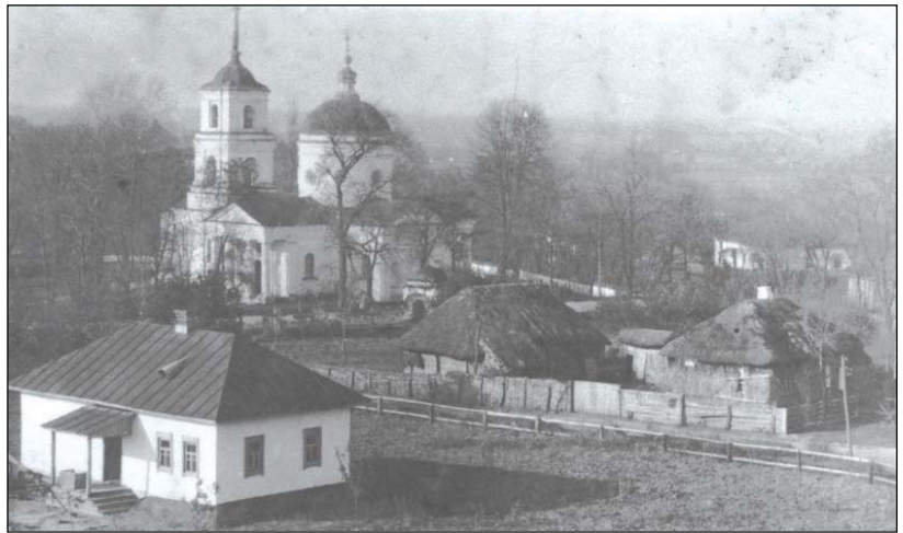
Покровська церква, фото М.Боканя 1934 р.

Заповідник «Гетьманська столиця» проводить велику роботу по збиранню, вивченню та популяризації пам'яток історії, культури, природи - нами зібраний колосальний матеріал, який розкриває маловідомі сторінки історії Гетьманської столиці. До Дня пам'яток історії та культури ми відкриваємо нову рубрику в якій будемо розповідати про втрачені пам'ятки Батурина, про ті об'єкти, які, на привеликий жаль, безслідно зникли з батуринських обривів. Багато пам'яток загинули від дії всеплинного часу, інші були зруйновані за розчерком пера