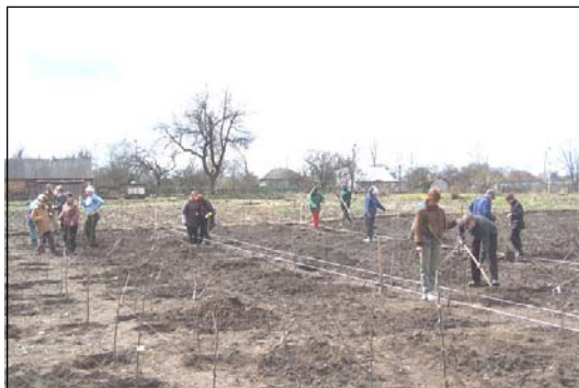
Закладання саду в парку «Кочубеївський», 12 квітня 2007 р.

Можливо наш приклад надихне і інші організації до проведення традиційних для українського народу толок щодо впорядкування належних їм територій. Закликаючи до поважного ставлення до проведеної роботи хочеться привести слова, які висічені на постаменті І. Скоропадському в Тростянецькому дендропарку: "Любезний прохожий, сад в котором ты гуляеш, посажен мной, он служил мне утешением в моей жизни. Если ты заметишь беспорядок, ведущий к уничтожению его, то скажи об этом хозяину, ты сделаешь доброе дело".