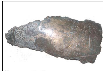
Уламок гармати XVII ст., із фондів колекції заповідника

З 1672р. генеральна військова артилерія мала штаб і базу в Батуричі. Але чи були серед батуричського арсеналу гармати власного виробництва? Письмових згадок про те ми не маємо, натомість маємо самі гармати, вилиті на замовлення гетьмана І.Мазепи. Нині одна з них, датована 1698р., зберігається у