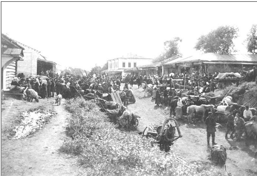
Одна із робіт М.Ф. Боканя, центральна вулиця Батурина, фото 1909 р.

який закохано розповідав про минуле сивочолого Батурина і його жителів. Звертаємось до небаїдухих до історії рідного селища батуринців з уклінним проханням допомогти у цій необхідній і важливій справі - якщо Ви маєте дома подібні фото, просимо Вас передати їх до заповідника, адже фотографія це важливий історичний документ, який допоможе у вивченні минулого Батурина.