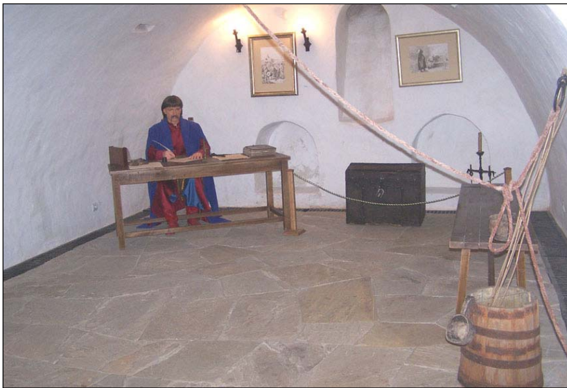
Камера слідства з восковою фігурою писаря, 2007р