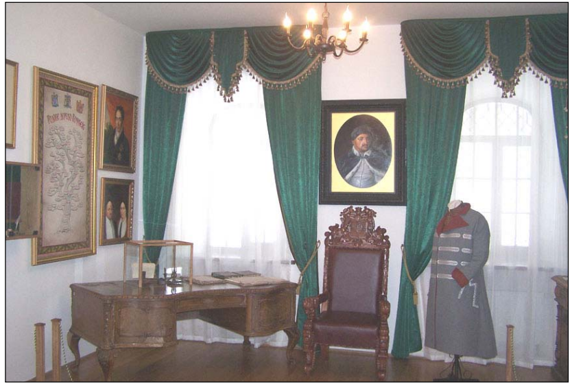
Інтер'єри залу №2, 2007 р.

монети, посуд розміщені в сучасних вітринах. Особливо глибоко розкривається історія родини Кочубеїв завдяки родовому дереву Кочубеїв, яке склали науковці заповідника, родинним портретам. Окрема вітрина присвячена автору славнозвісного козацького Літопису - С.Величку.