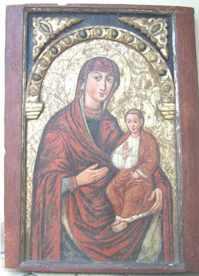
Богоматір Одигірія, 1677р.

І в справі формування фондової колекції для Музею Гетьманської слави ми зустрічаємо справжніх патріотів, серед яких Тарас Лозинський - колекціонер зі Львова, якому болить доля Батурина, для якого справа збирання є не лише обов'язком, а й любов'ю - любов'ю до свого краю, до України. Тисячі унікальних пам'яток українського мистецтва знайшов, врятував та зберіг Тарас Лозинський. Вперше він приїхав до Батурина в 2002 році, після чого подарував заповіднику унікальну ікону „Богоматір з Немовляма”, яку на початку 18 ст. гетьман Іван Мазепа подару-