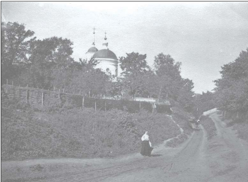
Покровська церква, фото М.Боканя, поч.ХХст.,

чиновників - та залишились в серцях людей, спогадах, фото, як то Храм Покрови Богородиці.