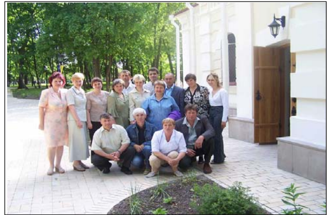
Колектив Батуринаського державного історико - культурного заповідника “Гетьманська столиця”

Проблематичним є наповнення Музею Гетьманської слави експонатами - адже впродовж століть з Батурина вивозилось все, що хоч чимось нагадувало про гетьманів. Експонати „Батуринаської тематики” розосереджені по музеях світу. Колекція, яку маємо сьогодні, зформована працею всього колективу, без виділення державних коштів на придбання експонатів (за 12 років діяльності „Гетьманської столиці” лише