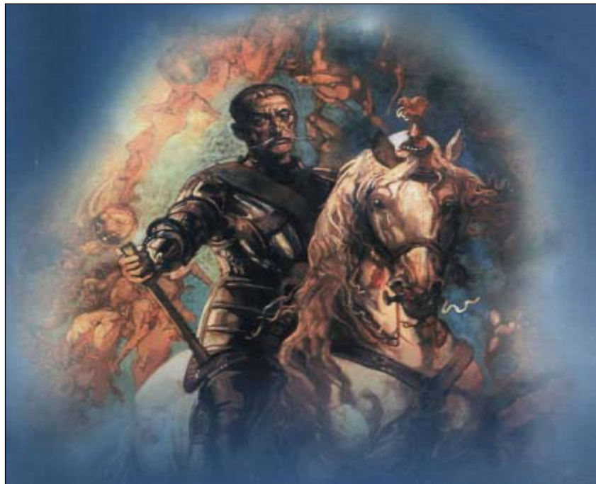
Іван Мазепа - титульна композиція до серії Сергія Якутовича "Мазепіана"

Після розорення Батурина резиденцію лівобережних гетьманів за указом царя Петра I було перенесено до Глухова. В 1718 році в цьому самому Глухові трапилася така історія.