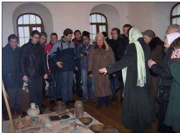
Студенти та викладачі національної академії мистецтв м. Київ та м. Харків в залах музею

заступник директора з наукової роботи БДІКЗ „Гетьманська столиця“