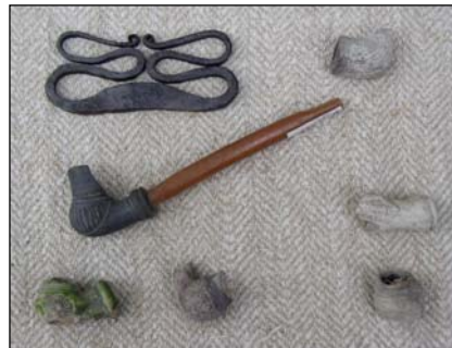
Козацькі люльки та кресало

зного віку, знахідки різноманітних слов'янських культур 1 тис. н.е., давньоруські матеріали тощо. Та найширше, зрозуміло, репрезентовані тут культурні рештки козацької доби. Шар цього періоду зафіксований роботами експедиції мало не на всій території сучасного Батурина. Ретельне картографування отриманих матеріалів та їх співставлення з уривчастими свідченнями письмових джерел