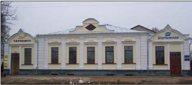
Будинок пошти після завершення реставраційних робіт, листопад 2006 р.

Поштова станція в Батурині, одна з найперших на Україні, була