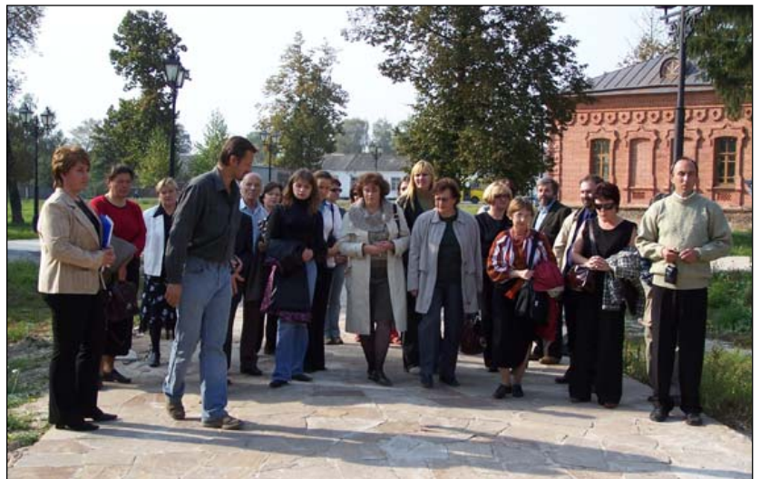
Учасники конференції «Культурно - релігійний розвиток Гетьманщини» кінця XVII - початку XVIII ст.», вересень 2006р.

- міжнародна україно-румунська археологічна конференція (липень, 1997р.)