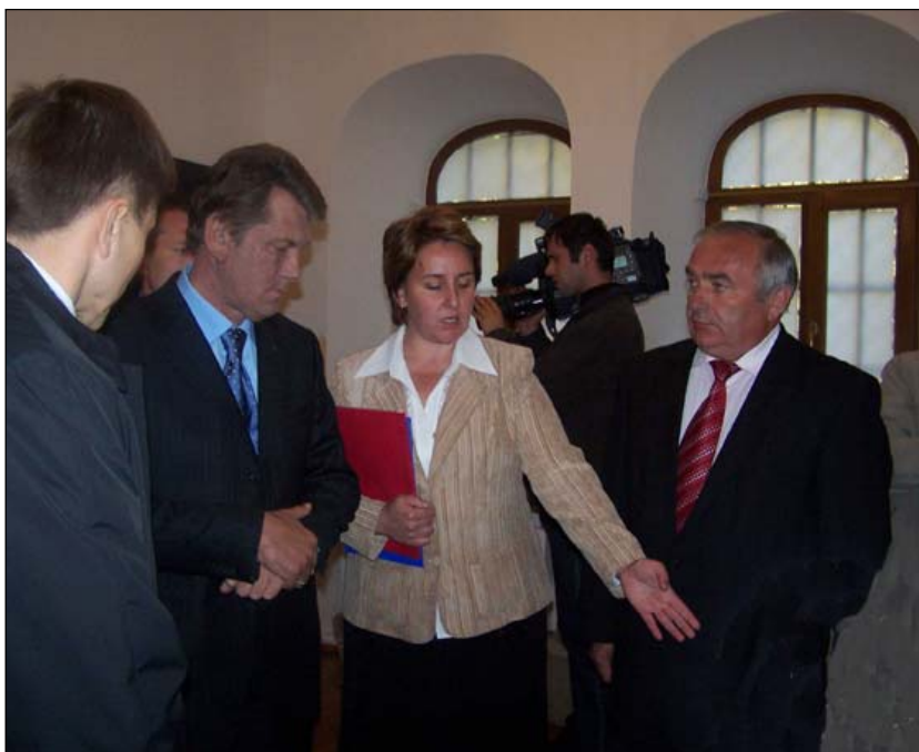
Президент В.А. Ющенко в Будинку генерального судді В.Кочубея, 11 жовтня 2006 р.

Слава всім, хто долучився до славної української сторінки». Він висловив надію, що дуже скоро постійна експозиція прикрасить музей.