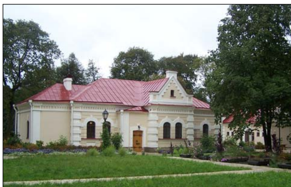
Будинок генерального судді В. Кочубея, після завершення реставраційних робіт

4.Цитадель Батуринської фортеці з музеєфікацією (після археологічних досліджень) фундаментів палацу І.Мазепи, церкви, скарбниці та благоустроєм території (з пам'ятним знаком (хрест) жертвам 1708 р. фрагментарним показом